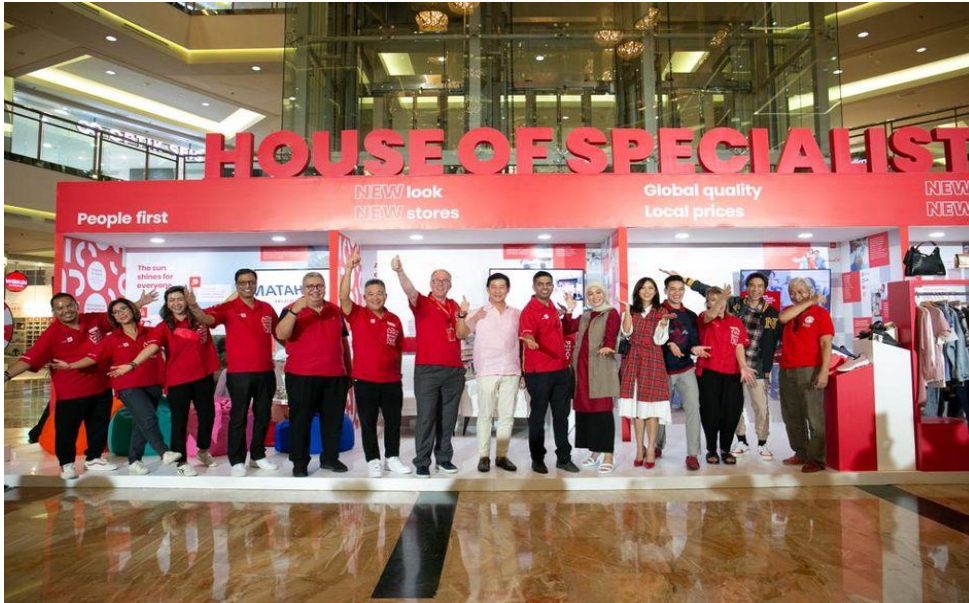
Gambar 2. 2 Dokumentasi Peresmian Konsep "House Of Specialists"

tempat berbelanja yang tetap memberikan produk berkualitas dengan harga yang terjangkau.