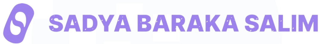
Gambar 2.1 Profil Perusahaan

Sadya Baraka Salim adalah perusahaan yang bergerak di bidang teknologi informasi dan pengembangan perangkat lunak. Perusahaan ini didirikan pada tahun 2023 dan mampu menyediakan solusi perangkat lunak end-to-end untuk berbagai kebutuhan bisnis. Fokus utama perusahaan adalah membantu mempermudah pekerjaan orang dengan menyediakan solusi teknologi yang efektif yang dirancang sesuai dengan kebutuhan spesifik industri.