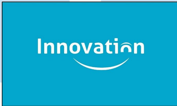
Gambar 2.1 Logo PT Global Innovation Technology

PT Global Innovation Technology pada gambar 2.1 merupakan perusahaan informasi, komunikasi, dan teknologi yang telah berdiri sejak tahun 2007 yang menyediakan sistem perangkat lunak yang selaras dengan bisnis dan manusia dengan solusi IT terhadap keamanan, compliance , telekomunikasi masa depan, dan e-financial di Indonesia. Dengan value yang dimiliki oleh PT Global Innovation Technology, yaitu customer-centric , innovative , excellence , integrity , care , dan team work , mampu menjadikan PT Global Innovation Technology sebagai mitra terbaik bagi solusi keamanan IT, paling efisien, serta menjadi aplikasi pelanggan di kawasannya. Selain itu, PT Global Innovation Technology percaya diri untuk melakukan ekspansi bisnis pada tahun 2008 ke cakupan wilayahnya dengan memegang kepercayaan bahwa bisnis dapat bertumbuh seiring berjalannya pengalaman dan kompetensi terhadap keamanan dan integrasi. PT Global Innovation Technology telah berhasil melakukan perkembangan perusahaan, yaitu mendapatkan partnership dengan beberapa perusahaan teknologi besar, meliputi Splunk, Oracle, dan IBM ( International Business Machine ) dan menjadi mitra bagi berbagai perusahaan di Indonesia, mencakup PT Jalin, Telkomsel, BRI, Mandiri, dan Badan Informasi Geospasial [11].