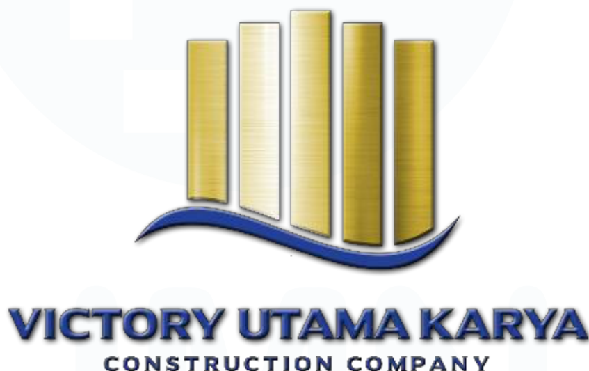
Gambar 2.1 Logo Perusahaan Victory Utama Karya