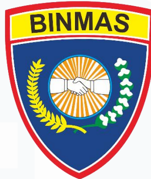
Gambar 2. 17 Logo Ditbinmas