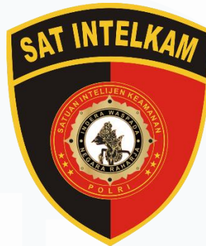
Gambar 2. 13 Logo Ditintelkam