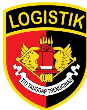
Gambar 2. 8 Logo Rolog