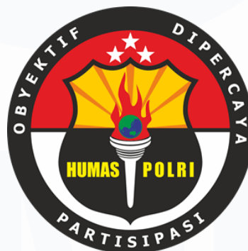
Gambar 2. 10 Logo Bidhumas