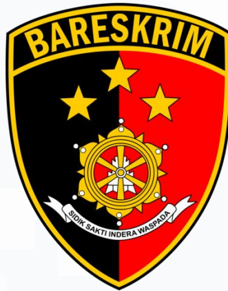
Gambar 2. 15 Logo Bareskrim Ditreskrimsus