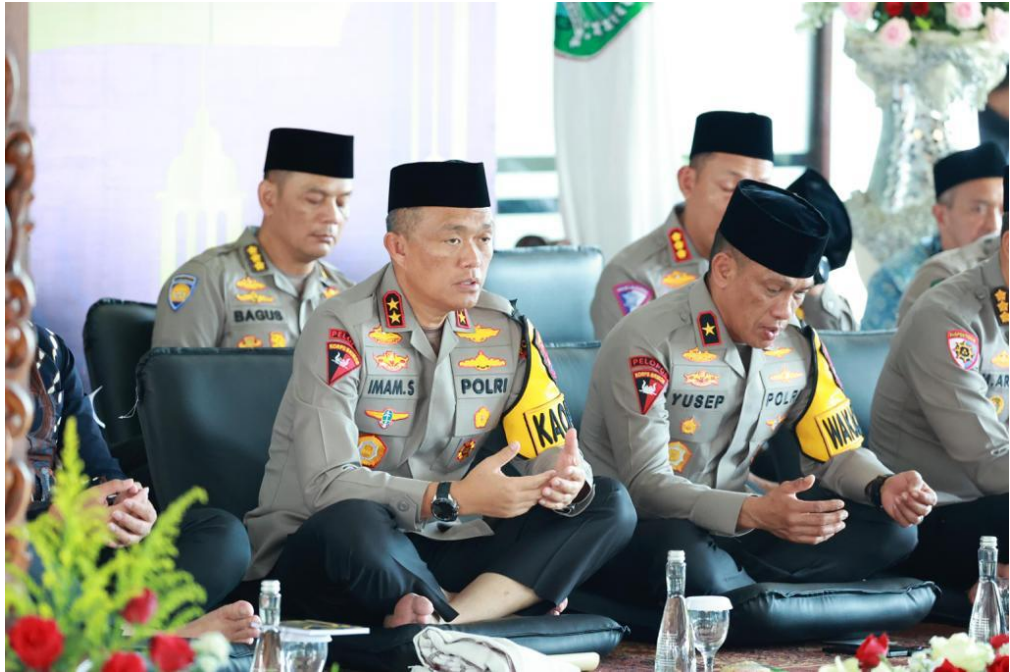
Gambar 2. 2 Bapak Kapolda dan Wakapolda

Pada gambar 2.2, Bapak Kapolda dan Wakapolda melakukan kegiatan pengajian di Polda Jatim. Sebelum berganti nama menjadi Polda Jatim, Polda Jatim bernama Komdak Jatim atau Komando Daerah Kepolisian Jawa Timur hingga saat ini menetapkan namanya sebagai Polda Jatim. Polda Jatim meliputi 39 kota/kabupaten di wilayah Jawa Timur, yaitu Polrestabes (Kepolisian Resort Kota Besar) di Surabaya, 3 Polresta (Kepolisian Resort Kota). 36 Polres (Kepolisian Resort).