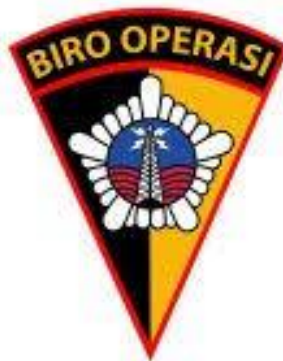
Gambar 2. 5 Logo Roops

Dipimpin Karo Ops, Bapak Kombes. Pol. Puji Santosa, S.H. Bertugas dalam menjalankan fungsi manajemen bidang operasi antara lain pelatihan pra operasi, koordinasi, serta kooperasi dalam rangka kegiatan kepolisian.