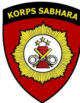
Gambar 2. 23 Logo Sabhara