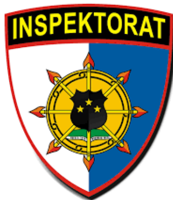
Gambar 2. 4 Logo Itwasda