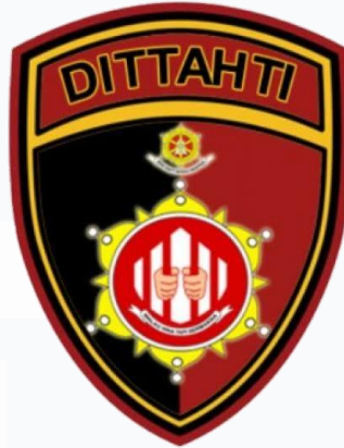
Gambar 2. 21 Logo Dittahti