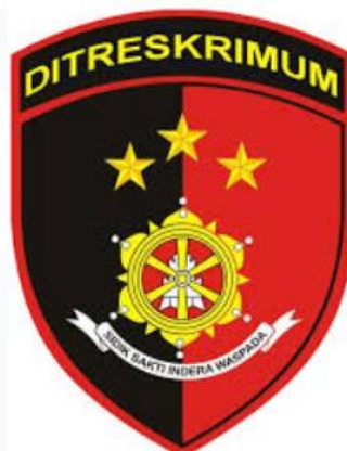
Gambar 2. 14 Logo Ditreskrimum

Dipimpin oleh Dirkrimum, Bapak Kombes. Pol. Totok Suharyanto, S.I.K., M.H. Bertugas menyelenggarakan penyelidikan, penyidikan, dan pengawasan tindak pidana umum,