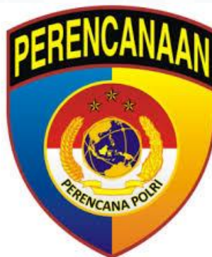
Gambar 2. 6 Logo Rorena