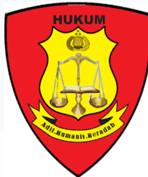
Gambar 2. 11 Logo Bidkum