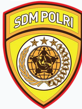
Gambar 2. 7 Logo Ro SDM