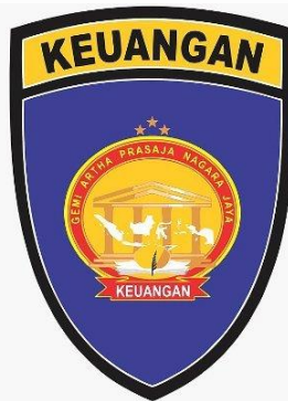
Gambar 2. 26 Logo Bidkeu