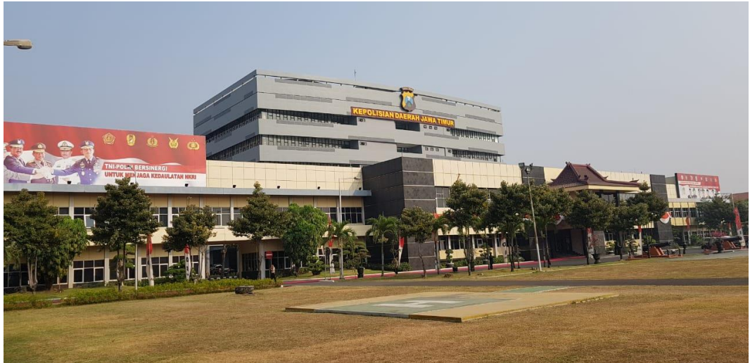
Gambar 2. 3 Markas Polda Jawa Timur

Gambar 2.3, Merupakan Gedung Kepolisian Daerah Jawa Timur yang ditempati oleh Bapak Kapolda dan Wakapolda. Serta keseluruhan anggota dibawah naungan Bapak Kapolda. Di markas ini, terdapat gedung-gedung satuan kerja lain, dengan jumlah bangunan mencapai lebih dari 30 gedung dan fasilitas lainnya.