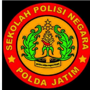
Gambar 2. 27 Logo SPN Jatim