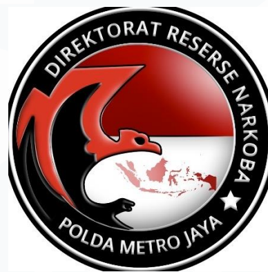
Gambar 2. 16 Logo Ditresnarkoba