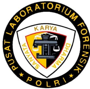
Gambar 2. 25 Logo Bidlabfor