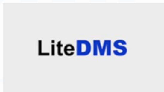
Gambar 2. 8 Logo LiteDMS

Lite DMS ( Document Management System ) merupakan aplikasi yang memungkinkan pengguna untuk mengelola dokumen secara digital. Lite DMS memungkinkan pengguna untuk mengarsipkan, merekam, dan menyimpan dokumen dalam format digital. Dengan fitur-fitur seperti manajemen konten, manajemen rekaman, pengaturan aplikasi, dan layanan antarmuka data, Lite DMS membantu meningkatkan efisiensi bisnis dengan mempermudah pencarian dokumen, meningkatkan keamanan dokumen dengan enkripsi, serta memungkinkan akses dokumen dari mana saja dan kapan saja melalui tautan langsung pada layanan web browser .