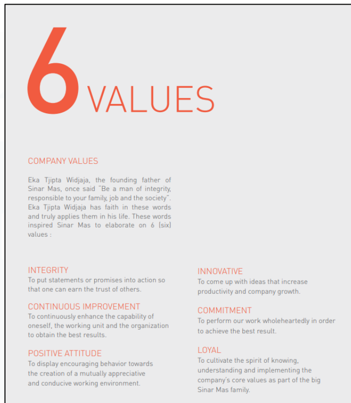
Gambar 2.5 Penjelasan Core Values dari Sinar Mas Land

Perusahaan juga menjunjung tinggi nilai-nilai core values dari Sinar Mas Land. Nilai-nilai tersebut menjadi dasar operasional sebuah perusahaan. Pendiri Sinar Mas Land, pak Eka Tjipta Widjaja meyakinkan bahwa kita harus menjadi pribadi yang berintegritas, bertanggung jawab pada keluarga, pekerjaan, dan masyarakat sehingga nilai-nilai tersebut menjadi pedoman bagi Sinar Mas Land dalam merumuskan enam prinsip etika yang mendasari operasional perusahaan. Nilai-nilai inti yang tercantum, seperti integritas, sikap positif, komitmen, peningkatan berkelanjutan, inovasi, dan loyalitas, merupakan refleksi dari upaya organisasi untuk membangun budaya kerja yang berorientasi pada kinerja dan nilai-nilai etika. Masing-masing nilai tersebut saling terkait dan saling memperkuat, membentuk suatu sistem yang koheren dan terintegrasi.