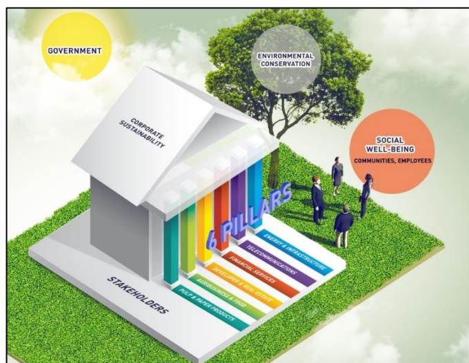
Gambar 2.2 Six Pillars of Sinar Mas Land