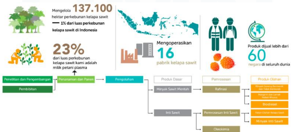
Gambar 2.3 Rantai Bisnis Perusahaan

Sinarmas Agribusiness and Food mengelola berbagai fasilitas untuk produksi kelapa sawit. Sinarmas mengoperasikan 16 pabrik kelapa sawit yang mengolah buah kelapa sawit menjadi minyak kelapa sawit mentah. Selain itu, perusahaan memiliki 4 pabrik pengolahan inti sawit yang bertugas memisahkan inti atau biji kelapa sawit dari buahnya [7]. Untuk meningkatkan kualitas minyak kelapa sawit, terdapat 4 pabrik rafinasi yang mengolah minyak mentah menjadi minyak kelapa sawit yang lebih bersih dan murni. Selain itu, Sinarmas juga menjalankan 2 pabrik biodiesel yang mengubah minyak kelapa sawit menjadi biodiesel, serta 1 pabrik oleokimia yang mengolah kelapa sawit menjadi bahan kimia untuk berbagai aplikasi industri. Gambar 2.3 berikut menunjukkan rantai bisnis perusahaan [8]: