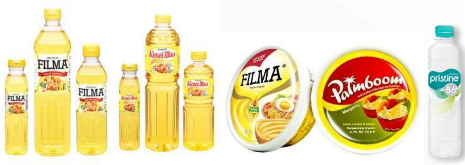
Gambar 2.2 Produk merek Sinarmas Agribusiness and Food

Sinarmas Agribusiness and Food mengelola berbagai fasilitas untuk produksi kelapa sawit. Sinarmas mengoperasikan 16 pabrik kelapa sawit yang mengolah buah kelapa sawit menjadi minyak kelapa sawit mentah. Selain itu, perusahaan memiliki 4 pabrik pengolahan inti sawit yang bertugas memisahkan inti atau biji kelapa sawit dari buahnya [7]. Untuk meningkatkan kualitas minyak kelapa sawit, terdapat 4 pabrik rafinasi yang mengolah minyak mentah menjadi minyak kelapa sawit yang lebih bersih dan murni. Selain itu, Sinarmas juga menjalankan 2 pabrik biodiesel yang mengubah minyak kelapa sawit menjadi biodiesel, serta 1 pabrik oleokimia yang mengolah kelapa sawit menjadi bahan kimia untuk berbagai aplikasi industri. Gambar 2.3 berikut menunjukkan rantai bisnis perusahaan [8]: