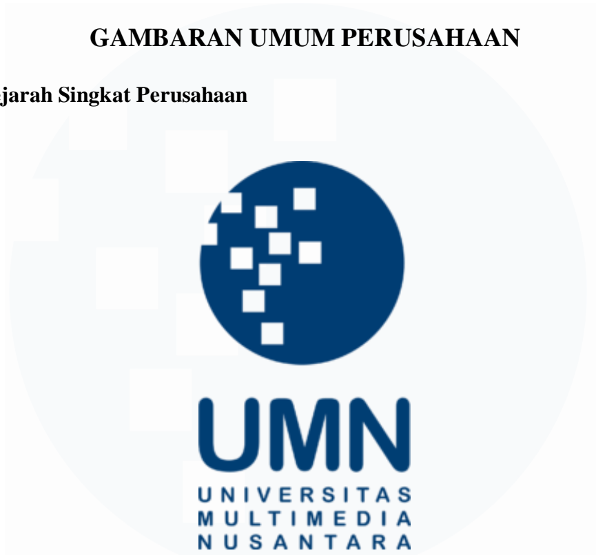
Gambar 2.1 Logo Universitas Multimedia Nusantara

Universitas Multimedia Nusantara merupakan sebuah universitas yang didirikan pada tanggal 20 November 2006 oleh Kompas Gramedia Group. Universitas Multimedia Nusantara berada di daerah Gading Serpong, Kabupaten Tangerang yang beralamatkan pada Jalan Scientia Boulevard Gading, Curug Sangereng, Serpong, Kabupaten Tangerang, Banten 15810. Universitas Multimedia Nusantara memiliki 4 fakultas, yaitu: