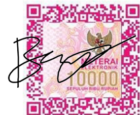
Bayu Baskoro Adjie