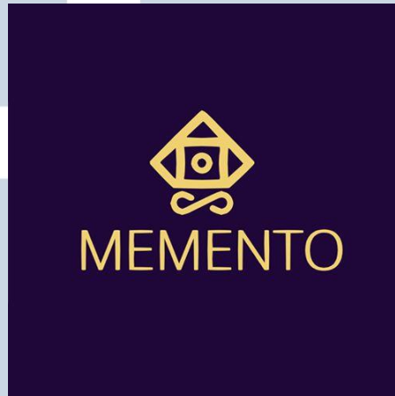
Gambar 2.1. Logo Memento Game Studios

Berikut adalah sebuah logo dari perusahaan Memento Game Studio sebagai berikut: