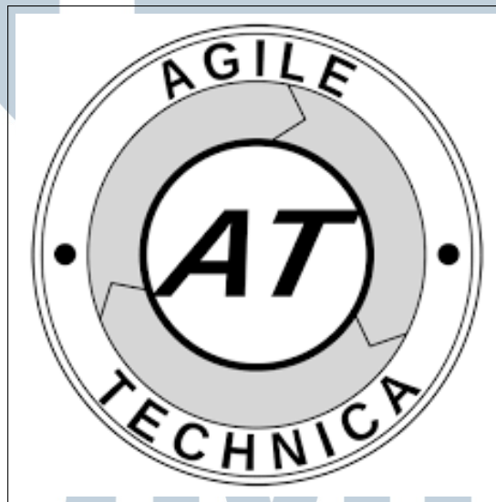
Gambar 2.1. Logo PT Sumber Inovasi Informatika

PT Sumber Inovasi Informatika merupakan perusahaan yang bergerak di sektor software consulting yang befokus pada pengembangan software Employee Resource Planning. Software ERP tersebut bertujuan untuk memenuhi kebutuhan bisnis-bisnis lain dalam mewujudkan efektifitas dalam mengelola sumber daya. Selain itu, PT Sumber Inovasi Informatika juga menawarkan agile training yang bertujuan untuk memberikan pelatihan seputar Agile Methodology dan membantu bisnis lain untuk mulai meng-implementasikan Agile Methodology .