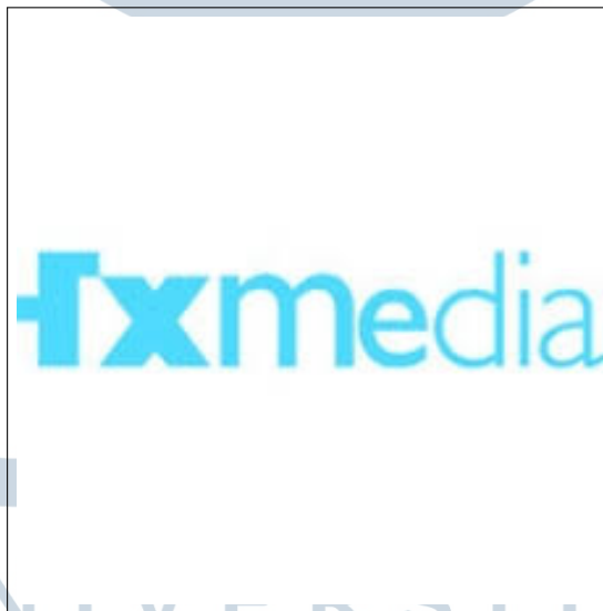
Gambar 2.1. Logo perusahaan FX Media

FX Media menciptakan media digital interaktif, mengubah ide-ide baru menjadi media digital interaktif yang menarik bagi audiens untuk belajar dari pengalaman. FX Media membentuk sebuah jembatan untuk menghubungkan dunia nyata ke dalam digitalisasi [3].