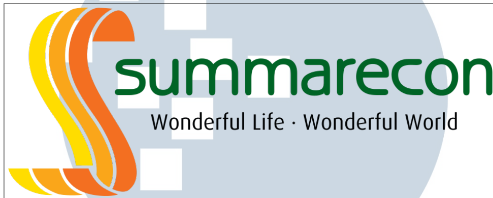
Gambar 2.1. Logo perusahaan PT Summarecon Agung Tbk Sumber: Website PT Summarecon Agung Tbk

Diambil dari website PT Summarecon Agung Tbk [3]. PT Summarecon Agung Tbk adalah perusahaan pengembang properti terkemuka di Indonesia, yang dikenal dengan keahliannya dalam mengembangkan proyek hunian dan komersial yang terintegrasi. Perusahaan ini didirikan oleh Soetjipto Nagaria dan keluarganya pada tahun 1975. Visi Summarecon Agung adalah untuk menciptakan komunitas yang berkelanjutan dan terencana dengan baik yang menawarkan kualitas hidup yang tinggi.