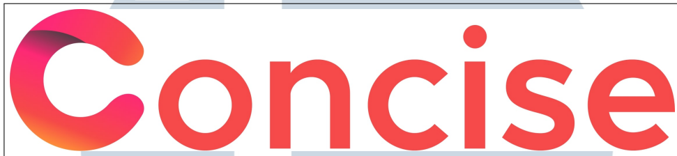
Gambar 2.1. Logo perusahaan PT Ganda Visi Jayatama

Berdasarkan hasil wawancara pada Lampiran 6, PT Ganda Visi Jayatama merupakan sebuah perusahaan yang bergerak di bidang IT Consultant yang dulunya berlokasi di Ruko Golden 8 Blok K No. 25. Hingga kini perusahaan ini telah bergerak selama kurang lebih 3 tahun dan sekarang berlokasi di Ruko Crystal No. 19 Gading Serpong. Selama kurun waktu tersebut, PT Ganda Visi Jayatama telah berkembang dengan pesat dan telah memiliki kurang lebih 20 karyawan dari berbagai divisi. Hingga tahun 2024, perusahaan ini telah menyelesaikan berbagai macam proyek, seperti Legal TINA, Spectacle, Kecap Inggeris, Home Mart, PMI Company Profile dan Habco Company Profile .