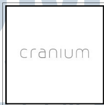
Gambar 2.2. Logo PT Cranium Royal Aditama

Logo dari PT Cranium Royal Aditama dapat dilihat melalui Gambar 2.2.