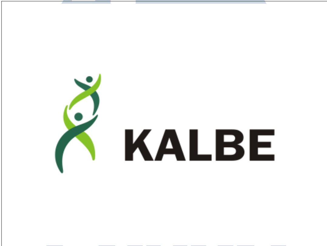
Gambar 2.1. Logo PT Kalbe Farma [1]

PT Kalbe Farma adalah sebuah perusahaan farmasi yang mendominasi industri di Indonesia, perusahaan ini didirikan oleh Dr. Boenjamin Setiawan pada tahun 1966. Awalnya dikenal sebagai PT Tunggal, perusahaan ini mulai beroperasi dengan memproduksi suplemen vitamin dan obat-obatan generik. Dengan tujuan yang kuat yaitu untuk menyediakan solusi kesehatan dengan harga yang terjangkau dan berkualitas bagi masyarakat Indonesia, Kalbe Farma mulai menarik perhatian dengan produk-produknya yang inovatif. [1]