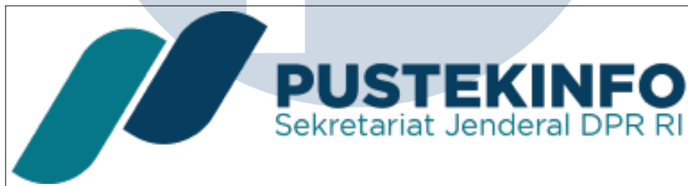
Gambar 2.1. Logo PUSTEKINFO

Pusat Teknologi Informasi (PUSTEKINFO) sebelumnya dikenal sebagai Bidang Data dan Teknologi Informasi (BDTI) yang merupakan bagian dari Pusat Data dan Informasi (PUSDATIN), perubahan signifikan terjadi sebagai respons terhadap dorongan untuk peningkatan dalam kebutuhan teknologi informasi. Dalam perjalanan ini, BDTI dipisahkan dari PUSDATIN dan diberi status mandiri sebagai Pusat Teknologi Informasi di bawah naungan eselon 2 Sekretariat Jenderal Dewan Perwakilan Rakyat Republik Indonesia (Setjen DPR RI). Dalam struktur organisasi yang baru, Pusat Teknologi Informasi memiliki peran yang lebih terfokus, dengan dua bidang kerja yang ditempatkan di bawahnya.