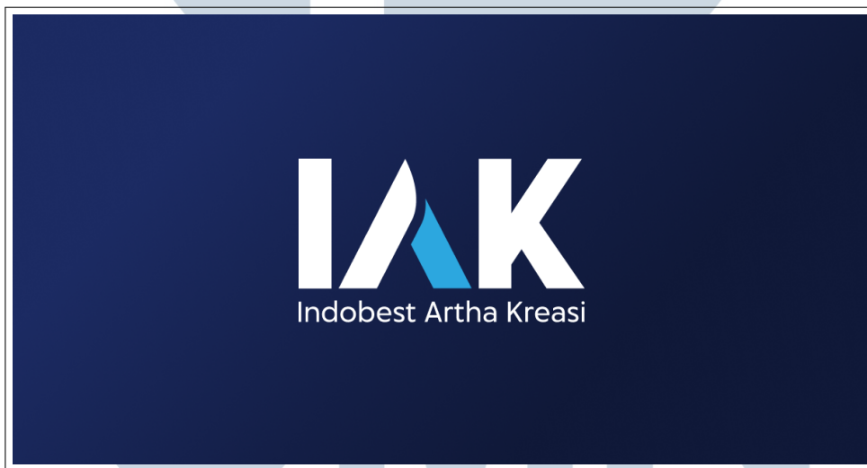
Gambar 2.1. Logo PT. Indobest Artha Kreasi