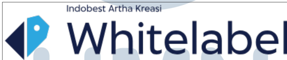
Gambar 2.3. Logo Whitelabel

Selain Mobilepulsa, PT Indobest Artha Kreasi juga merilils layanan dengan nama Whitelabel pada tahun 2014. Whitelabel menjadi cikal bakal API Mobilepulsa, menyediakan wadah bagi masyarakat untuk menjual produk Indobest Artha Kreasi sebagai pihak ketiga. Platform ini memungkinkan klien memiliki situs web dan aplikasi dengan nama sesuai keinginan dan kemampuan kustomisasi yang luas. Versi terbaru Whitelabel pada tahun 2019 memungkinkan klien untuk menjual berbagai barang dan memiliki e-commerce pribadi melalui situs web tersebut.