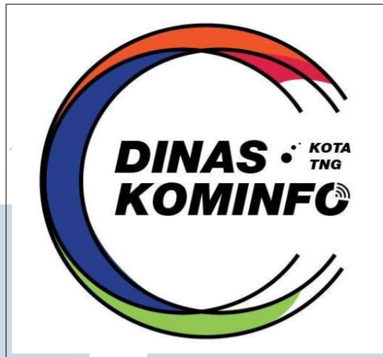
Gambar 2.1. Logo Dinas Komunikasi dan Informatika Kota Tangerang