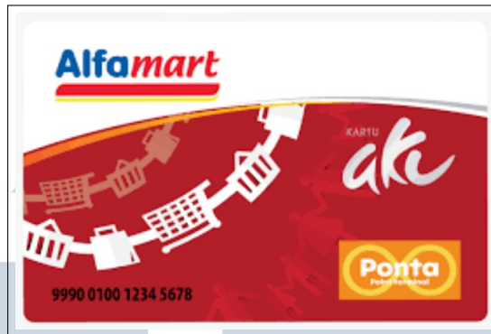
Gambar 2.4. Kartu Loyalty AKU Ponta