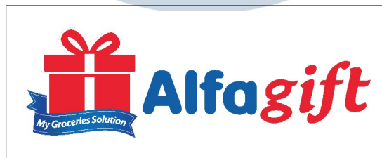
Gambar 2.5. Logo Alfagift

Pada tahun 2016, Alfamart melakukan rebranding Alfaonline menjadi Alfacart sebagai toko ritel online. Pada tahun 2019, Alfamart meluncurkan aplikasi Alfagift untuk iOS dan Android, serta mengakuisisi 75% saham Ponta, yang kemudian berganti nama menjadi PT Global Loyalty Indonesia (GLI). Pada tahun 2021, Alfacart dan Alfagift digabungkan menjadi satu platform yang tersedia sebagai aplikasi mobile dan website. Logo Alfagift dapat dilihat pada Gambar 2.5.