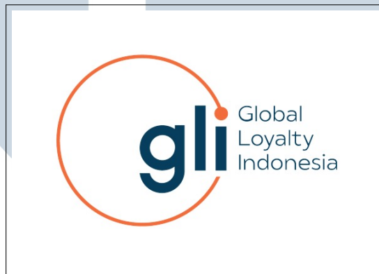
Gambar 2.1. Logo PT Global Loyalty Indonesia

Sejarah pembentukan PT Global Loyalty Indonesia dimulai pada 27 Agustus 1989 ketika toko Alfa Minimart didirikan oleh Bapak Djoko Susanto dan keluarganya [3]. Alfa Minimart ini adalah sebuah outlet minimarket yang fokus pada perdagangan eceran dan grosir melalui rangkaian gerai swalayan [4]. Logo PT Global Loyalty Indonesia dapat dilihat pada Gambar 2.1.