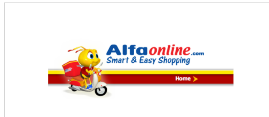
Gambar 2.3. Logo Alfaonline

Untuk meningkatkan aksesibilitas Alfaonline, Alfaonline Apps diluncurkan pada tahun 2015, tersedia di platform IOS dan Android. Pada tahun yang sama, Alfamart menjalin kemitraan dengan Ponta, sebuah perusahaan kartu untuk pembayaran elektronik. Kemitraan ini menghasilkan kartu keanggotaan loyalty "AKU Ponta", yang dapat digunakan untuk mendapatkan poin, diskon, promosi, undian, dan lain sebagainya. Logo Alfaonline dapat dilihat pada Gambar 2.3 dan kartu keanggotaan loyalty "AKU Ponta" pada gambar 2.4.