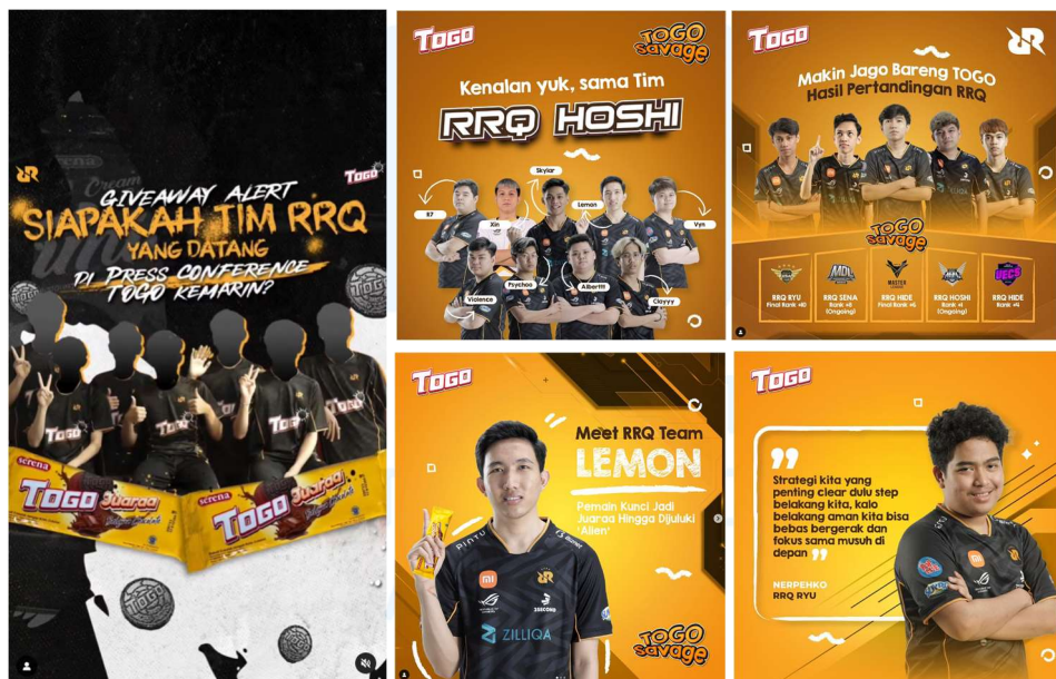
Gambar 2.4 Postingan Media Sosial Instagram Togo x RRQ Esport

Togo ialah produk Khong Guan Group yang merupakan biskuit sandwich berbentuk lingkaran yang dipasarkan untuk penggemar olahraga secara umum. Khong Guan kemudian bekerja sama dengan tim esport RRQ untuk menjadi brand ambassador dari produk Togo ini.