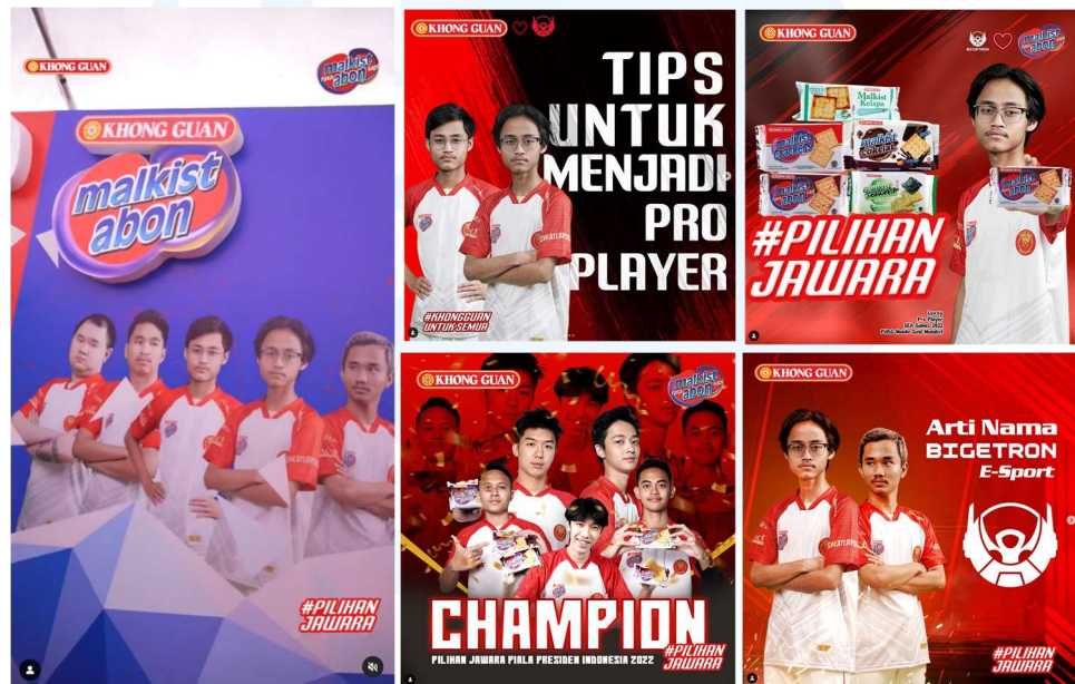
Gambar 2.2 Postingan Media Sosial Instagram Malkist x Bigetron Esport

Malkist merupakan produk biskuit cracker yang dipasarkan kepada penggemar esport . Khong Guan Group kemudian bekerja sama dengan klub esport Bigetron untuk menjadi brand ambassador produk Malkist. Kolaborasi ini menghasilkan desain untuk sosial media yang berisi promosi dengan foto tem RRQ esport di dalamnya.