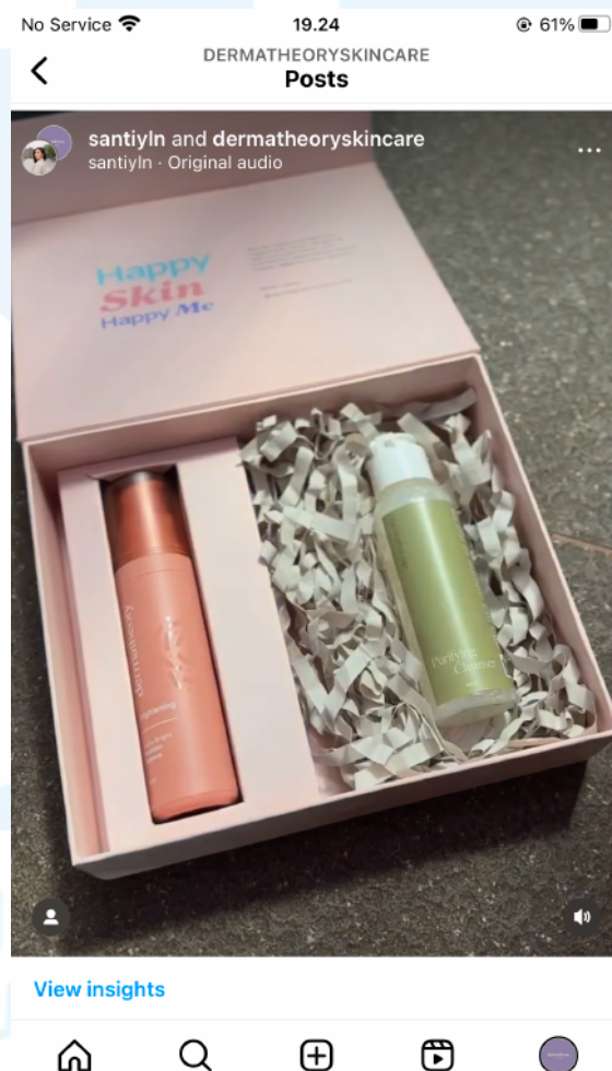
Gambar 2. 4 Dermatheory x Santyln