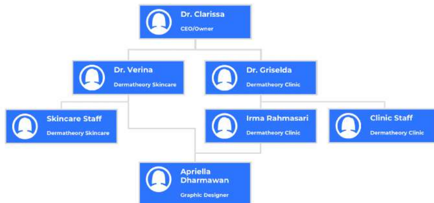
Gambar 2. 2 Bagan Struktur Perusahaan

Perusahaan Dermattheory memiliki susunan struktur pekerja yang memiliki pecahan utama dibagi menjadi dua yaitu bagian Dermattheory Skincare dan bagian Dermattheory Clinic. Struktur perusahaan ini tergolong sederhana karena tidak mencakup seluruh staff baik clinic maupun skincare. Kedua divisi baik skincare dan clinic saling bekerja sama satu sama lain sekalipun berada di dua divisi berbeda. Kerja sama antar dua divisi ini berkaitan dengan promosi, marketing, serta penjualan produk. Dalam bagan ini penulis bekerja dibawah kedua divisi ini, dalam artian penulis mengerjakan baik dari divisi skincare maupun dari divisi clinic. Kedua divisi ini memiliki platform sosial media masing masing yang keduanya dikelola oleh penulis baik konten maupun secara visual.