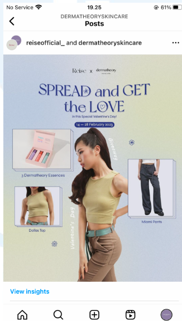
Gambar 2. 3 Dermattheory x Reise