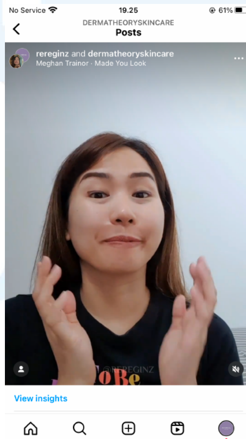
Gambar 2. 5 Dermattheory x Rereginz