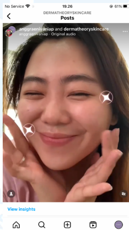
Gambar 2. 6 Dermattheory x Vania