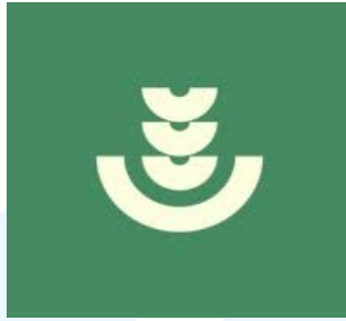
Gambar 2.4 leaders cafe