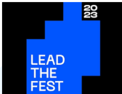
Gambar 2.3 lead the fest