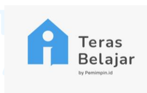
Gambar 2.5 Teras Belajar

Melalui Teras Belajar, peserta mendapatkan akses ke berbagai sumber daya pendidikan yang dirancang dengan cermat untuk memenuhi kebutuhan kepemimpinan modern. Program ini mencakup berbagai modul pelatihan yang mencakup topik-topik penting seperti strategi kepemimpinan, manajemen perubahan, komunikasi efektif, inovasi, dan pengambilan keputusan yang etis. Setiap modul dirancang oleh para ahli di bidangnya, memastikan bahwa peserta menerima informasi terkini dan relevan yang dapat diterapkan langsung dalam kehidupan profesional mereka.