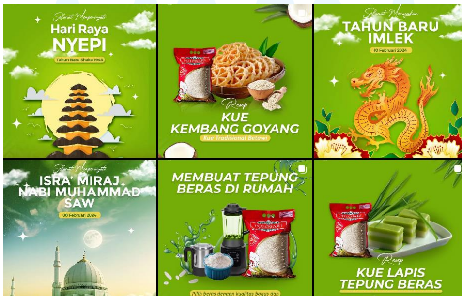
Gambar 2. 6 Portfolio Lini Bisnis PT Widodofood Makmur Sejahtera

Selain sosial media PT Widodo Makmur Perkasa, juga ada beberapa media sosial dari beberapa sosial media lini bisnis yang masih aktif mengpublish konten, seperti PT Widodo Makmur Unggas Tbk. Konten yang dibuat pun lebih banyak memuat seperti ensiklopedia tentang peternakan, greetings hari besar, dan juga resep makanan yang berkaitan dengan ayam.