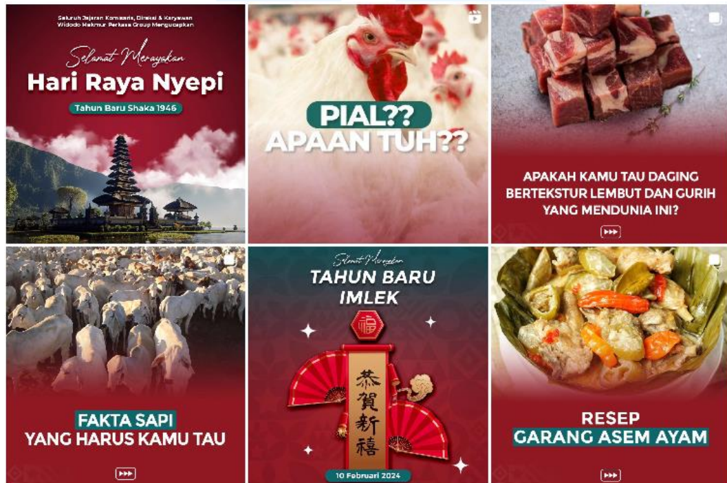
Gambar 2. 4 Portfolio PT Widodo Makmur Perkasa Tbk

Processing and Processed Products, Integrated Poultry Farm , Commodities Trading , dan Construction Energy . Dalam kegiatan promosi dan kegiatan penyebaran informasi, PT Widodo Makmur Perkasa Tbk telah membuat berbagai macam konten yang sudah ada pada Instagram feed dan story PT Widodo Makmur Perkasa Tbk. Berikut merupakan beberapa contoh konten yang sudah ada: