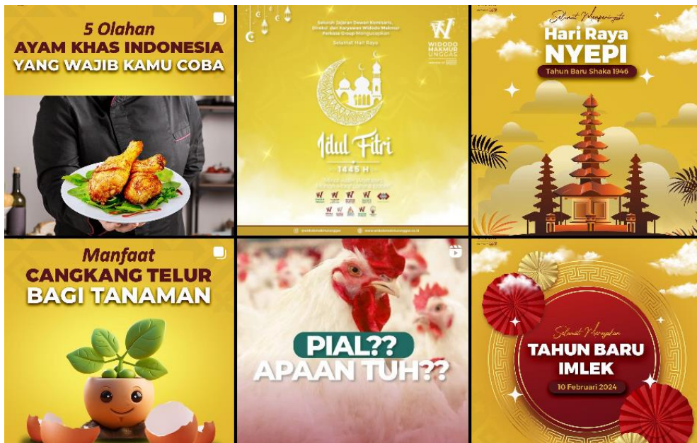
Gambar 2. 5 Portfolio Lini Bisnis PT Widodo Makmur Unggas Tbk