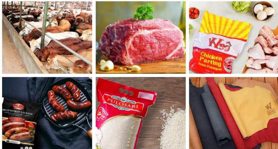
Gambar 2. 2 Produk PT Widodo Makmur Perkasa Tbk