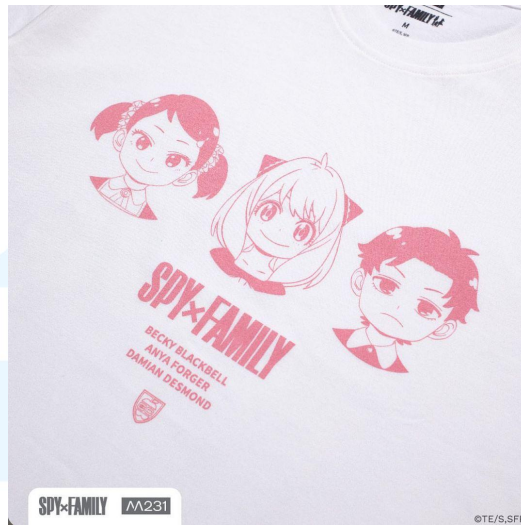
Gambar 2. 2 Collab M231 dengan SPY X FAMILY

Dengan terus memperluas jaringan kemitraan dan menjalin kerjasama yang strategis, M231 terus mengukuhkan posisinya sebagai pemimpin di industri fashion online. Kesuksesan merek ini tidak hanya terletak pada kemitraannya yang kuat dengan platform-platform besar dan tokoh ternama, tetapi juga dalam kemampuannya untuk terus berinovasi dan menyesuaikan diri dengan perkembangan pasar yang dinamis. Sebagai hasilnya, M231 tetap menjadi salah satu merek fashion paling diincar dan dihormati dalam dunia daring.