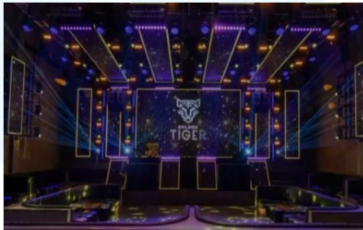
Gambar 2.6 Golden Tiger

Golden Tiger mengusung suasana yang sebanding dengan Gold Dragon, namun dengan desain yang lebih mencolok. Tempat ini didesain dengan konsep yang futuristik untuk menarik kalangan muda yang sedang mencari hiburan. Musik yang diputar di sini cenderung lebih terbuka dan komersial, sesuai dengan standar generasi saat ini.