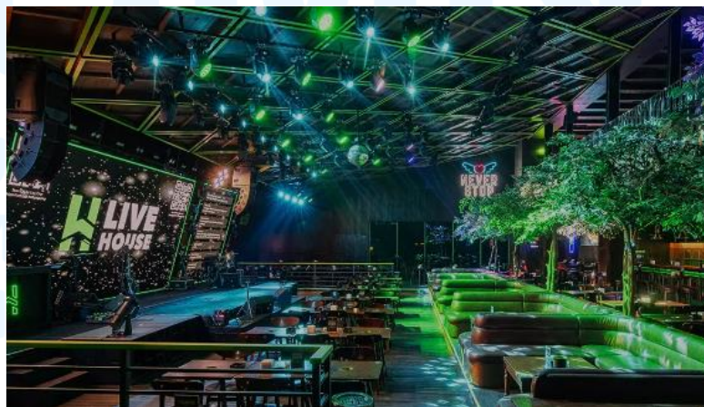
Gambar 2.3 HW Live House

HW Live House adalah sebuah tempat elegan bagi semua orang untuk bersantai dan menikmati waktu. Mengusung tema Live Music dengan suasana yang sederhana namun mewah, tempat ini menawarkan beragam makanan, cocktail , serta hiburan berupa live performance . Dengan layanan yang lebih ceria, energik, dan ramah, Livehouse menawarkan produk dengan harga yang terjangkau. Tempat ini menargetkan pelanggan dari berbagai rentang usia, mulai dari muda hingga usia pertengahan.