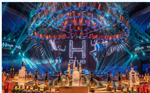
Gambar 2.8 W Superclub

The H Club, sebuah klub malam elit dan terbesar di Asia, dibuka di SCBD pada tanggal 28 April 2023. Klub malam ini dianggap sebagai salah satu yang terbaik di Asia. The H Club adalah salah satu dari banyak klub yang dimiliki oleh HWG, dan dikenal sebagai salah satu destinasi hiburan terkemuka di wilayah tersebut.