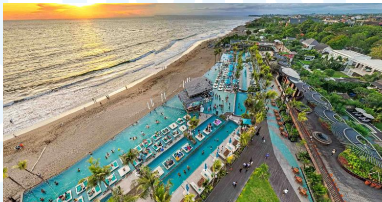
Gambar 2.10 Atlas Beach Fest

Atlas Beach Fest, merupakan klub yang terletak di tepi pantai Cangu, Bali. Atlas diakui sebagai salah satu beach club terbesar di dunia, menjadikannya tujuan yang sangat diminati bagi mereka yang ingin menikmati hiburan di tepi pantai dengan sentuhan kemewahan. Atlas menyediakan berbagai fasilitas mewah seperti restoran, rooftop , kolam renang, dan tentu saja klub malam yang diposisikan secara strategis untuk menikmati pemandangan matahari terbenam di laut.