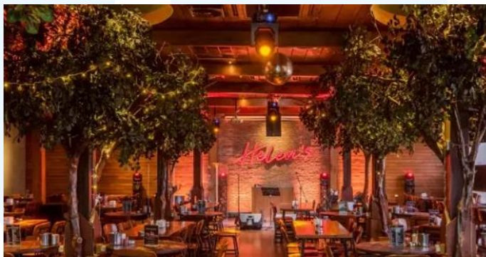
Gambar 2.4 Helen's

Helen's Live Bar berkomitmen menjadi destinasi hiburan yang memberikan pengalaman menyenangkan bagi para pengunjungnya, serta menjadi tempat interaksi antara mereka dengan berbagai jenis hiburan komersial. Hal ini menciptakan hubungan emosional yang membuat Helen's menjadi tempat yang nyaman bagi pengunjung untuk memenuhi kebutuhan gaya hidup dan sosial mereka.