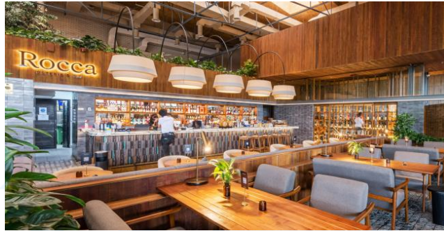
Gambar 2.9 Rocca

Dengan suasana yang santai namun tetap menyegarkan, Rocca menyajikan hidangan mewah kepada para pelanggan, menjadikannya pilihan yang sempurna bagi mereka yang ingin bersantai dan menikmati momen istirahat dari kesibukan perkotaan.