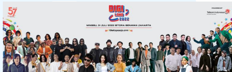
Gambar 2. 4 Digiland

Digiland 2022 merupakan suatu acara atau ajang yang diadakan oleh MDMedia, agensi pemasaran digital terkemuka. Pada Digiland 2022, MDMedia meraih penghargaan bintang 4 dalam ajang Top Digital Awards. Di acara ini, MDMedia mendemonstrasikan keunggulan mereka dalam berbagai bidang, termasuk strategi pemasaran digital, kreativitas konten, dan penggunaan teknologi terkini dalam industri digital.