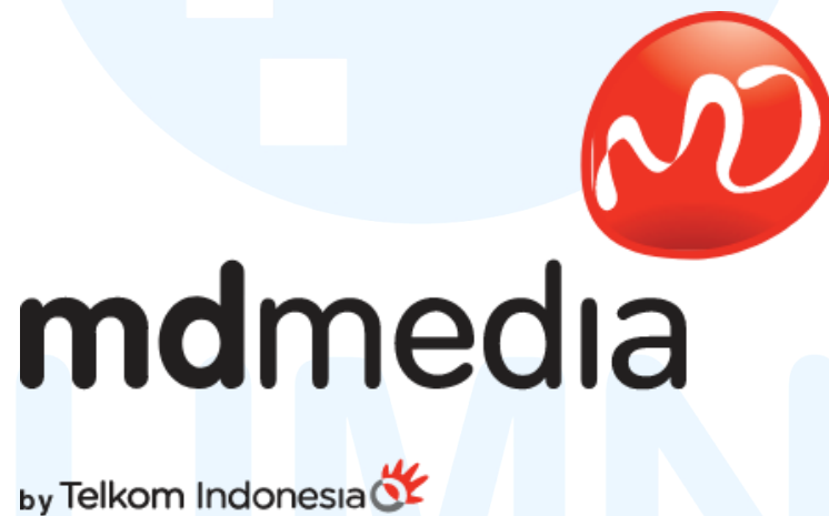
Gambar 2. 1 Logo PT. Metra Digital Media

PT. Metra Digital Media (MD Media), yang merupakan cabang perusahaan dari TelkomMetra, memiliki sejarah singkat yang dimulai pada tanggal 1 Mei 2013 saat perusahaan ini didirikan. MD Media memiliki fokus utama pada industri media dan periklanan, menyediakan layanan agensi yang meliputi berbagai aspek pemasaran dan periklanan. Sebagai bagian integral dari TelkomMetra, MDMedia memegang peran yang signifikan dalam ekosistem Telkom yang bertujuan untuk menyediakan solusi digital di Indonesia (TelkomMetra, 2023).