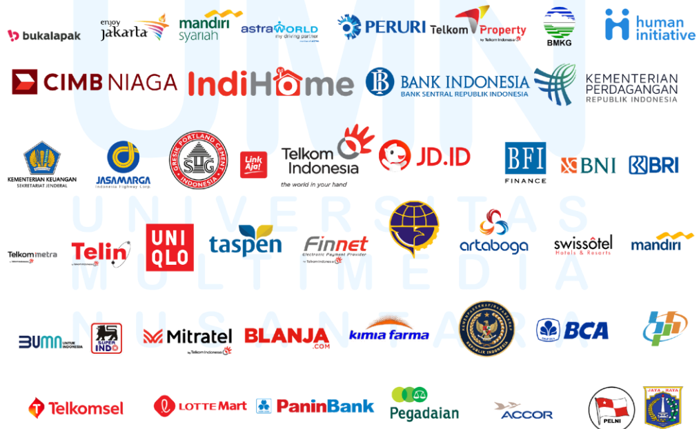
Gambar 2. 3 Klien Perusahaan

PT. Metra Digital Media adalah sebuah perusahaan besar yang memiliki berbagai macam bisnis di berbagai bidang. Awalnya, perusahaan ini fokus pada media digital, tapi sekarang telah berkembang menjadi perusahaan yang memiliki minat di bidang telekomunikasi, hiburan, teknologi, dan lain-lain. Mereka telah berdiri selama beberapa dekade dan dikenal karena ide-ide baru, keandalan, dan cara pandang yang maju. Anak perusahaan dan perusahaan yang terkait dengan PT. Metra Digital Media beroperasi di garis depan industri masing-masing, membantu dalam pertumbuhan dan mengubah wajah digital di Indonesia. Sebagai salah satu yang terdepan di dunia digital, PT. Metra Digital Media terus berkembang, menetapkan standar baru dan mengejar kemajuan dalam teknologi dan media.