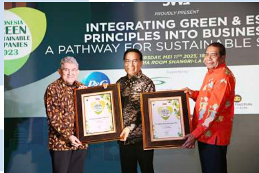
Gambar 2.4 App Sinar Mas merah penghargaan IGSCA 2023

(IGSCA) 2023 di Jakarta pada tanggal 11 Mei 2023. Penghargaan diterima di Hotel Shangri-la dan diberikan atas komitmen serta pencapaian APP Sinar Mas dalam menerapkan ESG (Environment, Social, and Governance) di lingkup operasional perusahaan.