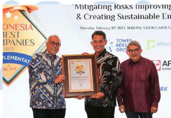
Gambar 2.5 App Sinar Mas meraih penghargaan Perusahaan Terbaik Indonesia

PT Perusahaan Kertas Tjiwi Kimia Tbk telah menerima penghargaan dari Majalah SWA sebagai Perusahaan Terbaik Indonesia dalam Penerapan HSE 2023 yang telah mengangkat tema “Mitigasi risiko, yang telah meningkatkan Produktivitas & Menciptakan #Sustainable Employability” Penghargaan tersebut akan diberikan sebagai pengakuan dari perusahaan yang berada di Indonesia sebagai penerapan dari Manajemen keselamatan dan Kesehatan kerja (SMK3)