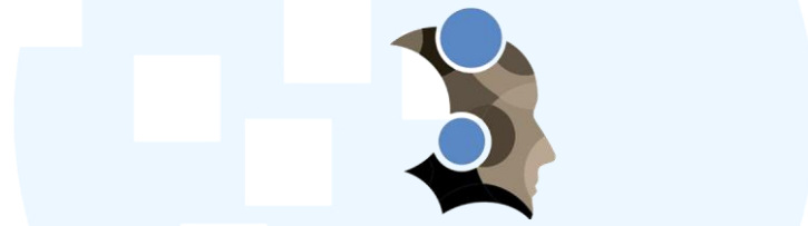
Gambar 2.5 Logo PT. Intelegensia Mustaka Indonesia (IMI)

Pada proyek yang dikerjakan oleh perusahaan, Datacomm sebagai perusahaan penyedia jasa dan solusi teknologi IT membantu dalam proses penyediaan dan pengelolaan informasi dan data untuk layanan teknologi finansial dimana kumpulan informasi dan data tersebut dikumpulkan dalam server yang telah dibuat oleh Datacomm sebagai penyedia server.