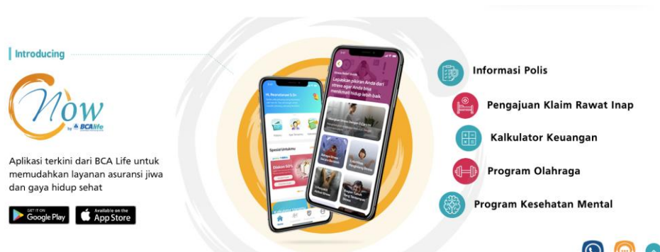
Gambar 2.3 Salah Satu Media Promosi NOW by BCA Life

NOW by BCA Life merupakan sebuah aplikasi dari PT Asuransi Jiwa BCA yang diluncurkan pada bulan Februari 2023. Aplikasi ini memiliki beragam fitur yang menarik dan terkini agar dapat menjadi solusi untuk memenuhi kebutuhan masyarakat dalam mengakses polis asuransi dengan mudah. Nasabah dapat menggunakan fitur-fitur yang beragam, seperti mengecek polis, menghitung simulasi premi, hingga fitur aktivitas untuk kesehatan tubuh dan kesehatan mental nasabah. Selain itu, hadirnya aplikasi NOW by BCA Life juga membantu para nasabah untuk melakukan klaim asuransi dimanapun dan kapanpun.