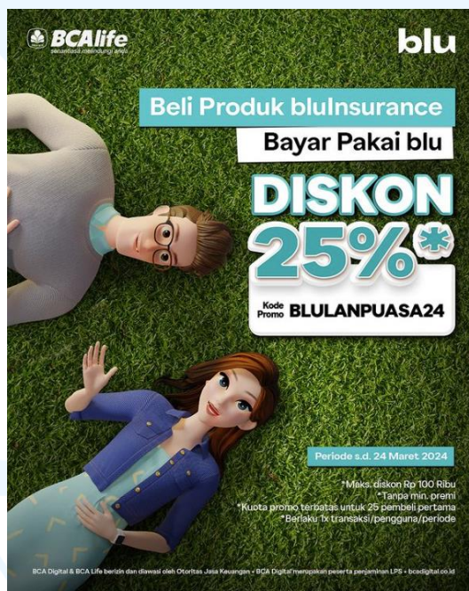
Gambar 2.6 Salah Satu Media Promosi bluInsurance

blu bekerja sama dengan BCA Life dengan menghadirkan produk-produk asuransi eksklusif, seperti blu Life Guard, blu Accident Guard, blu Life Protection, dan blu Accident Protection. blu Life Guard merupakan asuransi jiwa berjangka dengan perlindungan hingga 12 tahun dan manfaat perlindungan hingga 500 juta rupiah. blu Accident Guard merupakan asuransi untuk melindungi nasabah dari risiko kecelakaan hingga 12 tahun dengan manfaat perlindungan hingga 500 juta rupiah. blu Life Protection merupakan produk asuransi jiwa berjangka dengan manfaat perlindungan hingga 500 juta rupiah apabila nasabah meninggal dunia. blu Accident Protection merupakan produk asuransi untuk melindungi nasabah dari risiko kecelakaan secara tahunan dengan manfaat perlindungan hingga 500 juta rupiah. Seluruh produk asuransi ini dapat diperoleh tanpa cek medis.