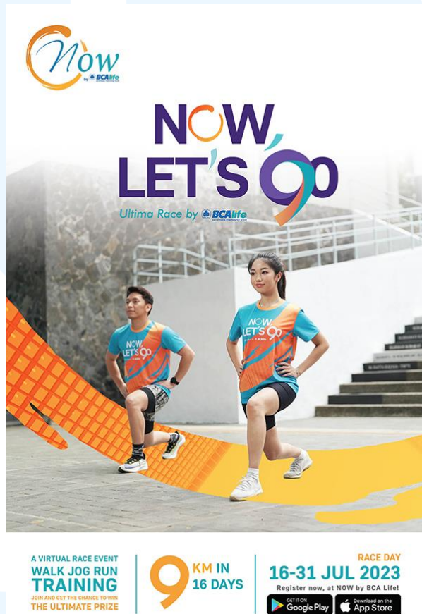
Gambar 2.4 Poster NOW LET'S GO Ultima Race by BCA Life

Pada Juli 2023, NOW by BCA Life berkolaborasi dengan Ultima Race by BCA Life yang merupakan acara tahunan perayaan hari jadi BCA Life dengan mengadakan ajang virtual race event yang berisi tantangan lari dan workout . Acara ini juga menjadi acara untuk mempromosikan aplikasi NOW by BCA Life yang baru saja launching di bulan Februari. Pendaftaran serta rangkaian challenge dapat melalui aplikasi NOW by BCA Life untuk mendapatkan poin yang dapat ditukarkan dengan beragam hadiah.