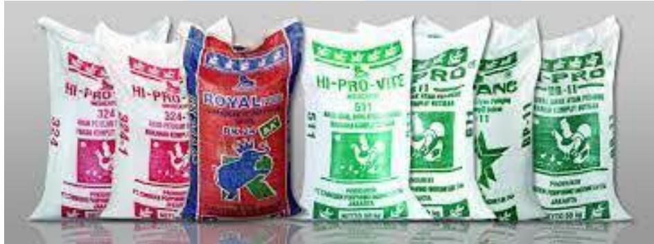
Gambar 2. 3 Produk Pakan PT Charoen Pokphand Indonesia Tbk

Dalam melakukan aktivitas usahanya PT Charoen Pokphand Indonesia Tbk diantaranya, meliputi berbagai industri makanan ternak khususnya perunggasan, pengepakan daging dan rumah potong hewan, pengawetan serta pengolahan daging, pembuatan bumbu masak, tepung, produk farmasi hewan, pergudangan, pengemasan plastik, ruang pendingin, dan jual beli hewan hidup.