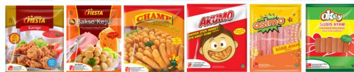
Gambar 2. 7 Produk Makanan CPIN