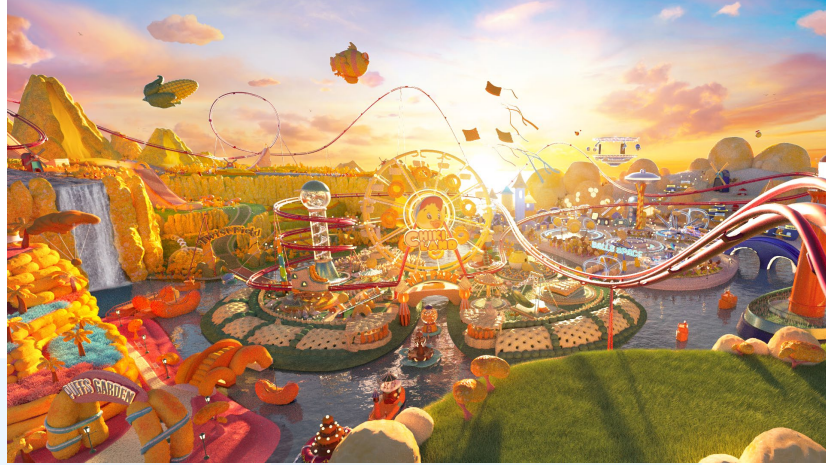
Gambar 2.3 The Wondrous Chiki Land

berhasil membuat universe yang berisi produk-produk Chiki namun dengan approach yang surrealis dan unik.