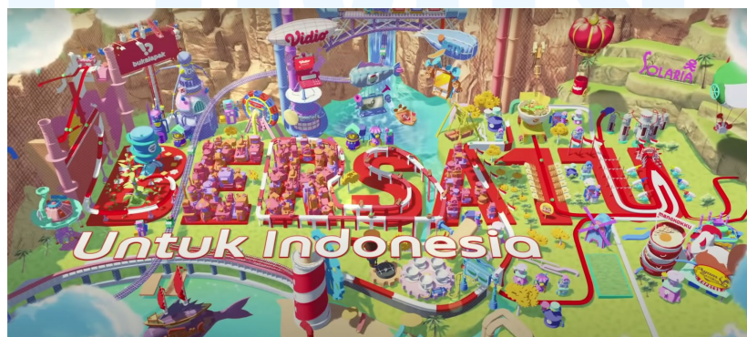
Gambar 2.5 Bersatu

Grab adalah aplikasi serba bisa yang membantu penggunanya untuk menikmati layanan pengantaran, mobilitas, jasa keuangan, dan lainnya. Bersatu merupakan proyek animasi yang dikerjakan untuk Grab. Konsep yang diangkat pada animasi ini adalah mesin pinball dengan nuansa steampunk dengan warna yang vibrant . Pada mesin pinball tersebut terdapat bola hijau yang terus berjalan melewati seluncuran air dan mie raksasa yang akan diakhiri dengan gestur yang bijaksana.