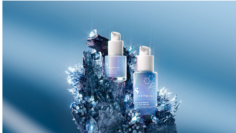
Gambar 2.4 Diamond Dust

banyak cahaya yang berkilau dari berlian. Karakteristik warna-warna yang digunakan pada visual video ini menyerupai kemasan serum Somethinc yaitu iridescent colors .