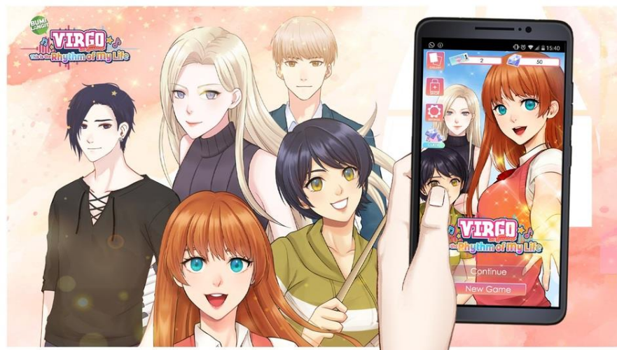
Gambar 2. 7 Virgo and The Sparkling: Rhythm of My Life

Game Virgo Virgo and The Sparkling: Rhythm of My Life merupakan hasil kerja sama Eternal Dream dengan Bumi Langit pada 2021 lalu. Game ini merupakan gamification dari Webtoon Virgo and The Sparkling yang sudah memiliki penggemar besar. Pada kesempatan ini, Eternal Dream berperan sebagai coder dan game designer untuk memanfaatkan aset-aset visual yang sudah disediakan menjadi satu game .