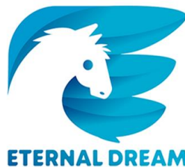
Gambar 2. 1 Logo Eternal Dream Studio

PT. Eternaldream Games Internasional atau dikenal sebagai Eternal Dream Studio adalah studio game indie yang didirikan pada September 2017 oleh Lucky Putra Dharmawan. Eternal Dream merupakan studio game pertama dan satu-satunya yang berbasis di Lampung. Eternal Dream berfokus mengembangkan game naratif dengan pesan yang menumbuhkan empati pemainnya. Eternal Dream sudah terdaftar di Indonesia Game Association dan lulus dari Telkom Indigo Game Startup Incubation batch pertama. Eternal Dream juga disebut sebagai “ Startup Local Heroes Lampung ” oleh Kemenparekraf. Dikutip dari wartalampung.id (2022), pada 26-29 Mei 2022 lalu Eternal Dream dipilih menjadi salah satu dari delapan studio game lokal yang mewakili Indonesia di Indie Craft, pameran game Korea Selatan, secara daring.