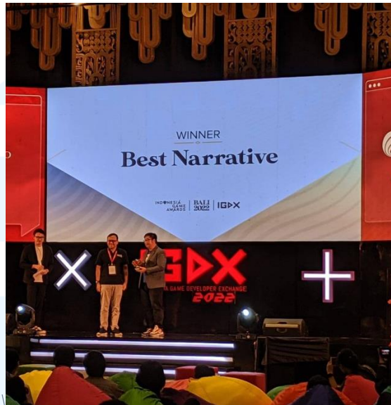
Gambar 2. 4 Penghargaan Best Narrative untuk Eternal Dream

Selain visual, ciri khas karakter juga digambarkan melalui gaya bicara sehingga pemain bisa memahami dan menebak sifat para karakternya.