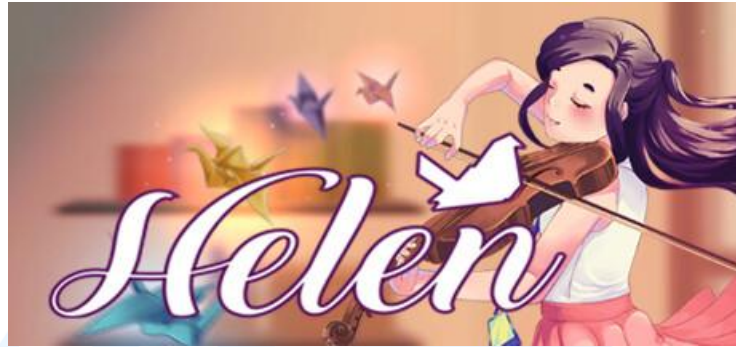
Gambar 2. 5 Helen