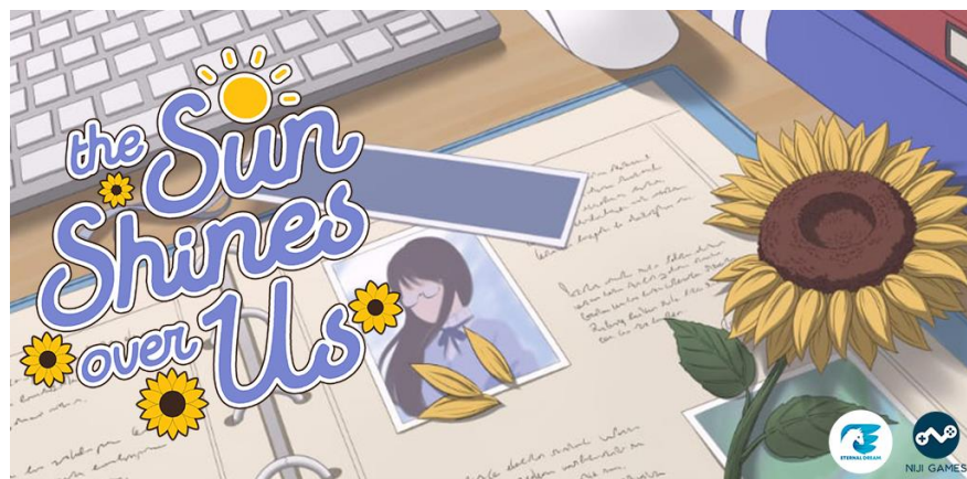
Gambar 2. 3 The Sun Shines Over Us

Menggapai Matahari atau The Sun Shines Over Us merupakan game visual novel hasil kolaborasi Eternal Dream dengan Niji Game Studio yang mengangkat tema mental health remaja Sekolah Menengah Atas. Game ini menyentuh hati para pemainnya dengan mengisahkan Mentari, gadis yang menjadi korban bullying yang berusaha sembuh dari trauma. Di sekolah barunya, Mentari harus mencoba bersosialisasi lagi dengan teman-teman baru. Pemain harus membantu Mentari untuk mampu melawan rasa takut yang dialaminya.