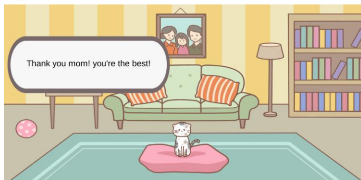
Gambar 2. 6 My Decade Furriend

My Decade Furriend merupakan game kasual dan heartwarming yang merupakan hasil game jam internal di Eternal Dream pada 2023 lalu. Sesuai dengan judulnya, My Decade Furriend mengisahkan seekor kucing menemani pemiliknya selama satu dekade. Kucing yang diberi nama Inchi ini ditemukan pemiliknya ketika cuaca hujan. Karakter Inchi diceritakan sangat menyayangi dan setia kepada pemiliknya. Selain itu, Inchi juga selalu ada untuk menemani pemiliknya ketika melewati lika-liku permasalahan hidup seperti konflik keluarga.