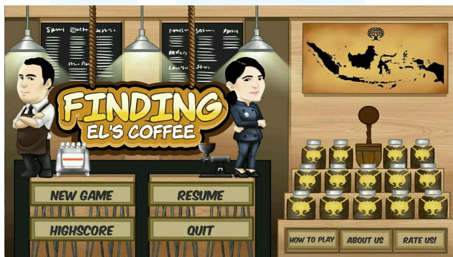
Gambar 2. 8 Finding El's Coffee

Finding El's Coffee merupakan gamification hasil kerja sama dengan toko kopi lokal di Lampung sebagai media promosi brand pada 2017. Game ini dapat diunduh melalui Play Store yang diakses dengan smartphone . Visual pada game didominasi warna tersier coklat agar selaras dengan branding toko kopi.