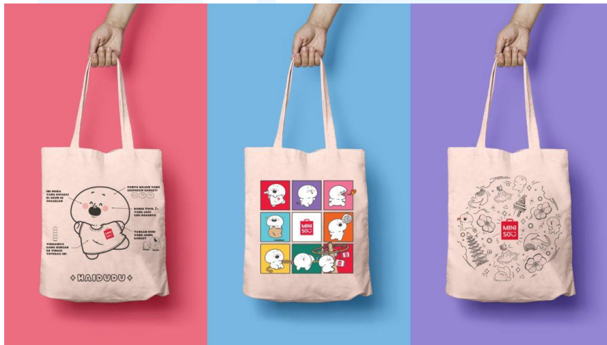
Gambar 2.8 Hai Dudu x Miniso

Sebagai karakter IP utama dari Infia, Hai Dudu telah berkolaborasi serta melakukan aktivasi dengan sejumlah brand dan events . Salah satu kolaborasi brand dengan Hai Dudu adalah dengan Miniso Indonesia. Hai Dudu berkolaborasi dengan Miniso Indonesia dalam rangka merayakan hari kemerdekaan Indonesia yang ke-78. Produk yang dijual dalam kolaborasi ini adalah totebag yang bertemakan tujuh keajaiban dunia serta kemerdekaan Indonesia yang digabungkan dengan identitas Hai Dudu.