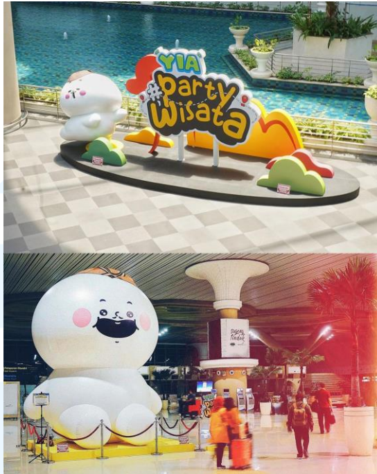
Gambar 2.9 #YIAPartyWisata