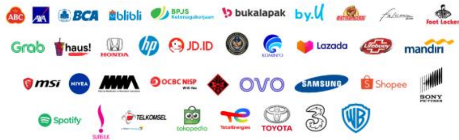
Gambar 2.4 Kolaborasi Brand

Sebagai agensi media dan periklanan, Infia sudah berkolaborasi dan membantu berbagai perusahaan dengan pelayanan yang ditawarkan. Dengan tim konsultan yang terdiri dari ahli-ahli multidisiplin dan pengalaman industri yang sudah lama terbukti, Infia sudah membantu ratusan klien di berbagai bidang dan industri untuk memperoleh tujuan mereka (Infia Media Pratama, 2023). Selain itu, Infia juga pernah berkolaborasi dan membantu penyelenggaraan sejumlah event seperti JSD 2023, Tahilalats x Sinchan, dan Dalang Pelo & Si Aa.