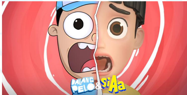
Gambar 2.7 Dalang Pelo & Si Aa

Pada 22 Maret 2023, Dalang Pelo berkolaborasi dengan Studio Animasi Rans dan menciptakan animasi visual 2 Dimensi Dalang Pelo dengan visual 3 Dimensi Si Aa. 14 Episode Animasi berdurasi 3 – 4 menit dibuat untuk kedua channel youtube, 7 Episode pertama di channel Dalang Pelo dan sisanya dapat ditonton di channel Rans Animation Studio .