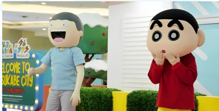
Gambar 2.6 Tahilalats x Sinchan

Setelah itu, Tahilalats x Sinchan merupakan kolaborasi jangka panjang antara tahilalats dan karakter kartun Jepang yang terkenal yaitu Sinchan. Kolaborasi ini diadakan untuk merayakan anniversary ke 30 dari Crayon Sinchan. Hasil kolaborasi ini meliputi sejumlah produk dari LocknLock berupa alat makan serta produk edisi special dari Somethinc.