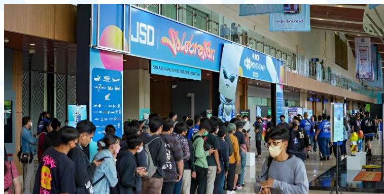
Gambar 2.5 JSD 2023

The Jakarta Sneaker Day 2023 merupakan event offline yang diadakan pada 23 – 26 Februari 2023 di Ice BSD City didukung oleh bank BCA. Acara ini dipersembahkan oleh Infia Pariwara Nusantara dan berhasil menarik 96.298 pengunjung.