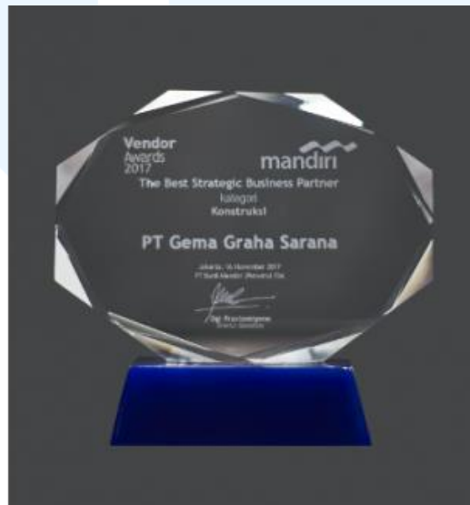
Gambar 2.4 Mandiri Vendor Award 2017

VIVERE Group berkomitmen untuk mendukung karya, bahan, serta desainer lokal berkualitas ke ranah internasional. Oleh karena itu, VIVERE Group tidak hanya berperan sebagai vendor yang memasarkan produk dan jasanya sendiri, tetapi juga sebagai penyalur atau distributor utama produk-produk brand luar negeri. Contoh brand luar negeri yang bekerja sama dengan VIVERE Group dalam penjualannya adalah VITRA, Steelcase, Milliken, Lightspace, dan JEB Partitions. Sebagai business partner yang mendukung para kliennya, VIVERE Group mendapat penghargaan sebagai “The Best Strategic Business Partner” pada Mandiri Vendor Award tahun 2017 dalam bidang konstruksi.