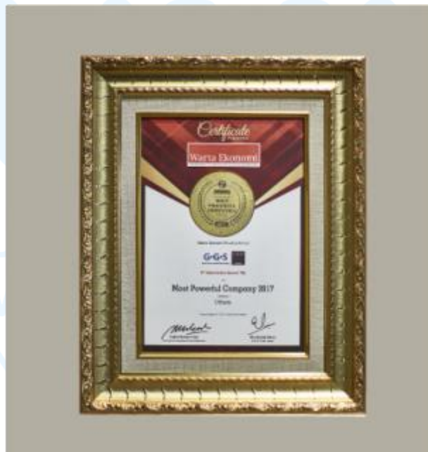
Gambar 3.3 Indonesia Most Powerful Companies Award (IMPCA) 2017

Dalam perjalanannya sebagai perusahaan furnitur yang bersaing di Indonesia, VIVERE Group telah menerima banyak penghargaan. VIVERE Group telah menerima penghargaan atas kesehatan dan keselamatan kerja dari Exxon Mobil, ConocoPhillips, Pertamina, dan Petrosea. Hal ini sejalan dengan salah satu pilar core values VIVERE Group, yaitu keamanan dan keandalan. Ada pun penghargaan dalam lingkup desain bagi produk-produk furnitur dan laminasi dari VIVERE Group baik di dalam negeri maupun kancan internasional. Karena prestasi dan performa VIVERE Group yang berhasil dipertahankan dan dikembangkan meski kondisi ekonomi global yang kurang baik saat itu, VIVERE Group diberi penghargaan oleh Warta Ekonomi sebagai “The Most Powerful Companies in the Indonesia Most Powerful Companies Award (IMPCA)” pada tahun 2017.