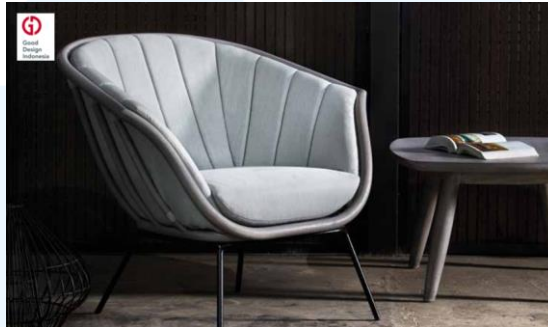
Gambar 2.5 PORTABELLA Lounge Chair

Direktorat Jenderal Pengembangan Ekspor Nasional (DJPEN), Kementerian Perdagangan Republik Indonesia, sejak tahun 2017. Selain menerima sertifikat yang ditandatangani oleh Menteri Perdagangan Republik Indonesia, pemenang penghargaan GDI difasilitasi untuk turut serta dalam Good Design Award di Tokyo, Jepang untuk berkompetisi dalam taraf internasional.