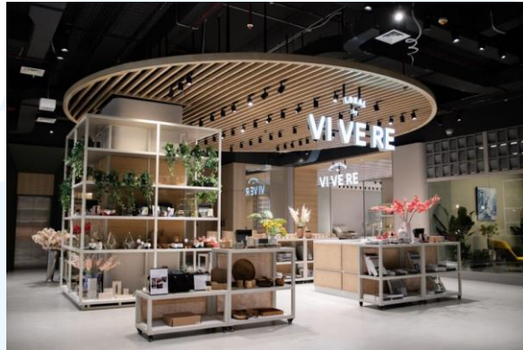
Gambar 2.8 Lokal by VIVERE

keterampilan bagi UKM agar dapat mengembangkan potensinya. Salah satu upaya pemberdayaan UKM oleh VIVERE Group yaitu Lokal by VIVERE Initiative, yaitu koleksi produk pilihan yang dikumpulkan melalui sourcing , ideating , design processing , dan seleksi produk seniman lokal dengan standar kualitas internasional.