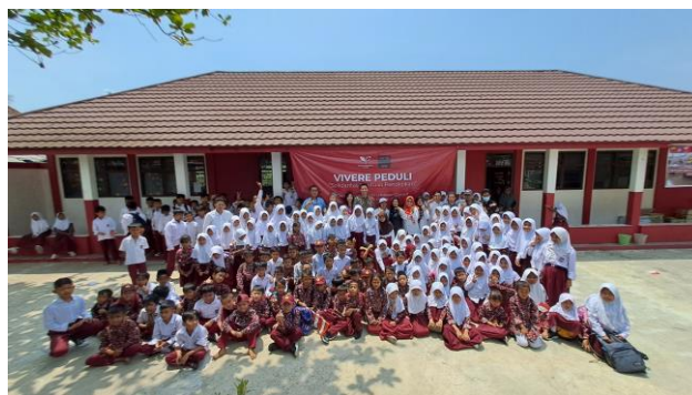
Gambar 2.9 VIVERE for Education

VIVERE Group memegang teguh core value -nya yaitu quality life for all . VIVERE Group tidak hanya ingin berperan dalam mengembangkan industri furnitur dan interior, tetapi juga mengembangkan kehidupan di lingkungan sekitar. Sebagai perusahaan yang menghargai pendidikan, VIVERE Group bekerja sama dengan institusi-institusi pendidikan di Indonesia, termasuk universitas dan perguruan tinggi, untuk memfasilitasi bakat-bakat yang dapat dikembangkan melalui pendidikan dengan memberi beasiswa penuh dan pemenuhan biaya hidup.