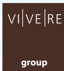
Gambar 2.1 Logo VIVERE Group

VIVERE Group memulai perjalanannya dengan mendirikan PT Gema Graha Sarana (GGS) pada tanggal 7 Desember 1984. Saat memulai usahanya, VIVERE Group hanya memiliki 10 orang pekerja saja. Seiring berkembangnya usaha, dibutuhkan suatu badan yang mengelola internal VIVERE Group agar lebih terintegritas, maka lahirlah corporate VIVERE Group yang dikelola di bawah PT Virucci Indogriya Sarana (VIS) pada tahun 1994. PT Virucci Indogriya Sarana (VIVERE Group) menawarkan jasa konsultan dan manajemen bagi seluruh perusahaan bagian VIVERE Group (GGS Annual Report , 2015).