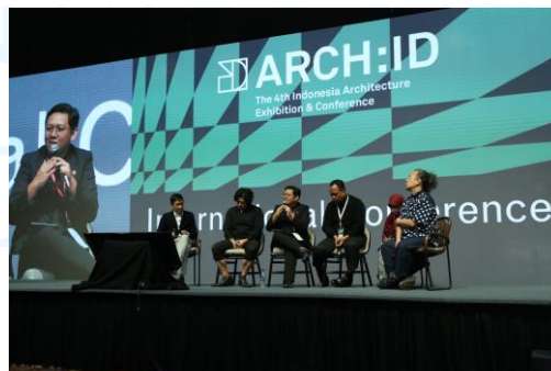
Gambar 2.6 ARCH:ID 2024

ARCH:ID adalah acara tahunan yang diselenggarakan oleh Ikatan Arsitek Indonesia (IAI) dan PT Citra Inovasi Strategi Exhibition (PT CIS Exhibition) dengan tujuan menjadi wadah networking , eksplorasi, dan pertukaran informasi mengenai desain dan arsitektur. ARCH:ID 2024 diadakan pada tanggal 25 Februari 2024 di ICE BSD, Tangerang. Sebagai acara arsitektur terbesar di Indonesia, ARCH:ID dihadiri oleh arsitek, developer , produsen, lembaga pemerintah, dan pemangku-pemangku kepentingan lainnya. VIVERE Group berperan sebagai sponsor ARCH:ID yang juga menyiapkan pameran produk-produknya atas kerja sama dengan IAI. VIVERE Group juga mengadakan dua Talk Series pada tanggal 22 dan 23 Februari 2024 (VIVERE Group, 2024).