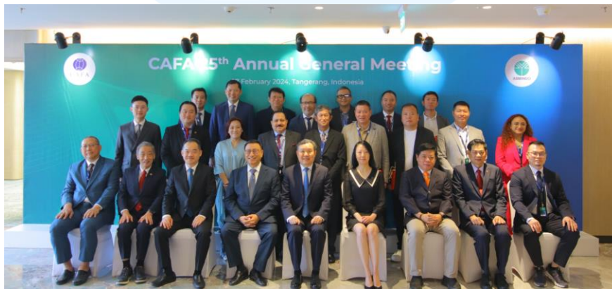
Gambar 2.7 CAFA 25 th Annual Meeting

CAFA adalah acara tahunan yang dihadiri oleh delegasi-delegasi CAFA dari 10 negara di Asia (VIVERE Group, 2024). Indonesia menjadi tuan rumah untuk pertemuan tahunan CAFA yang ke-25 pada tanggal 27 dan 28 Februari 2024 di Hotel VIVERE, Tangerang. VIVERE Group berperan sebagai tuan rumah dan sponsor. Beberapa kegiatan yang dilakukan dalam pertemuan tahunan CAFA yang ke-25 antara lain penandatanganan perjanjian kesepakatan antara ASMINDO (Asosiasi Industri Permebelan dan Kerajinan Indonesia) dan CNFA (China National Furniture Association), pembacaan dan penandatanganan inisiatif penggunaan bambu sebagai pengganti plastik di industri furnitur Indonesia, konferensi dengan tema “ promoting sustainable furniture ecosystem leading to net zero emission ”, kunjungan pabrik dan kampus, pameran produk-produk kerajinan tangan dan furnitur berbahan bambu dan rotan, serta gala dinner .