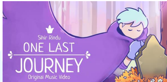
Gambar 2. 3 One Last Journey

dengan nama Cain yang ingin bertemu kembali dengan kekasihnya yang sudah meninggal.