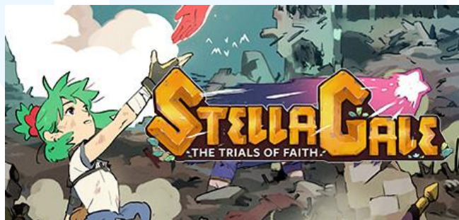
Gambar 2. 2 Stella Gale: The Trials of Faith

Gim besar utama Extra Life Entertainment adalah Stella Gale: The Trials of Faith, gim tersebut dijadwalkan untuk keluar pada tahun 2024. Stella Gale: The Trials of Faith adalah gim 2D hack and slash RPG yang memiliki konsep battle arena . Gim tersebut menceritakan mengenai karakter Stella dan Gale yang berusaha menjadi petarung terkuat di koloseum untuk mendapatkan jawaban dari misteri terkait dengan ayah mereka.