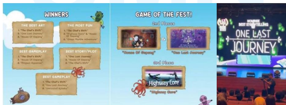
Gambar 2. 4 Penghargaan Extra Life Entertainment One Last Journey

Gim yang berada dalam tangan Extra Life Entertainment menarik perhatian pemain secara lokal hingga internasional, hal tersebut ditunjukkan dari beragam macam acara game developer exchange dimana karya milik Extra Life Entertainment dipamerkan seperti Level Up KL, Bogor Illustration Fair, IGDX, Festival Indonesia Pesta Anak Bangsa, Domino FX, Motion Ime Festival, dan G2G Indonesia.