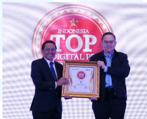
Gambar 2. 5 Acara Top PR Digital Award 2023

Januari 2023. Sebelumnya, riset ini dilakukan melalui metode desk research kepada 811 perusahaan emiten dan 500-an perusahaan non-emiten. Dalam prosesnya, terdapat tiga parameter, yaitu Digital Media Aspect , Digital Sentiment Aspect , dan Digital Awareness Aspect . Hasilnya, diketahui bahwa terdapat 20,5 juta ulasan dari perusahaan emiten dan non-emiten.