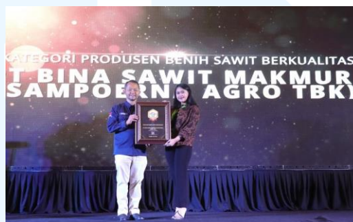
Gambar 2. 4 Sawit Indonesia Award 2022

kelapa sawit Indonesia. Pemenang award ini sudah melewati penilaian tim Majalah “Sawit Indonesia” dan online voting terhadap 2.000 pembaca. Dengan demikian, hal tersebut menjadi salah satu syarat kredibilitas terhadap pemenang Sawit Indonesia Award. Jika ditotalkan, terdapat 55 penghargaan yang dibagikan Sawit Indonesia dan terbagi menjadi beberapa kategori.