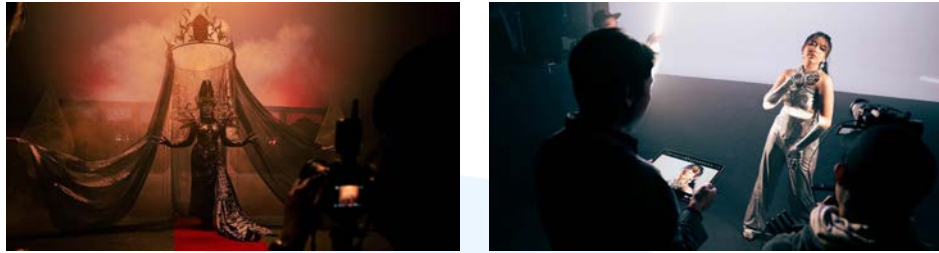
Gambar 2.6 Karya Fotografi BTS Video Musik Ngeluwih

Selain itu, perusahaan juga telah bekerja sama dengan Tiara Andini sebagai perwakilan dari Universal Music Indonesia pada video musik lainnya. Video musik tersebut adalah Flip It Up yang dinyanyikan oleh Tiara Andini pada proyek lainnya. Tentu, klien lainnya yang bersama Universal Music Indonesia telah mempercayakan beberapa proyek video musiknya kepada EUIS Studio.