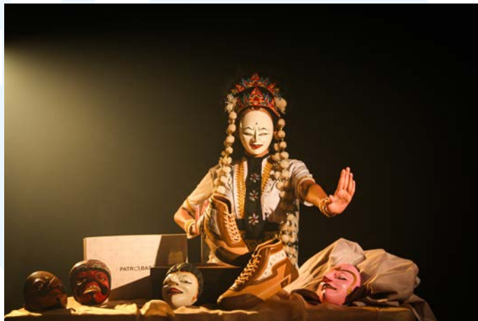
Gambar 2.5 Karya Foto Produk Sepatu Patrobas dan Budaya

Patrobas merupakan merek sepatu lokal Indonesia yang pernah bekerja sama dengan EUIS Studio. Kerja sama tersebut terjalin melalui perilisan sepatu baru yaitu Patrobas EL Clasico v2 yang membutuhkan video perilisan sebagai promosi untuk memikat konsumen. Dengan demikian, berikut adalah produk yang dipromosikan Patrobas bersama EUIS Studio.