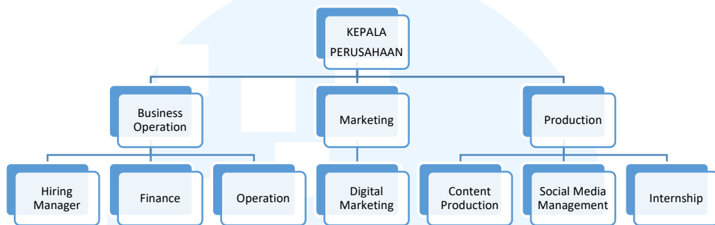
Gambar 2.2 Contoh Bagan Struktur Organisasi Perusahaan

perusahaan dapat bekerja dengan baik melalui kerja sama antar anggotanya untuk membagi tugas sesuai perannya masing-masing. Dengan demikian, berikut adalah struktur organisasi yang terdapat di dalam EUIS Studio.