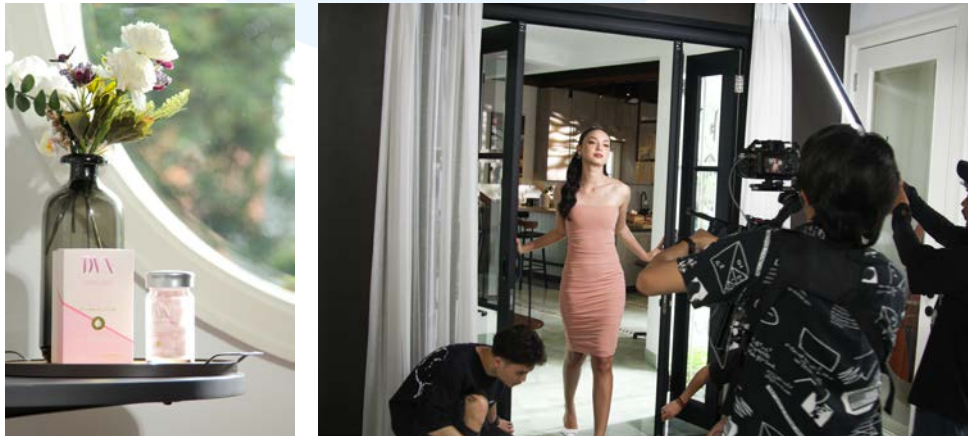
Gambar 2.8 Karya Fotografi BTS Pembuatan Iklan DVN

EUIS Studio pernah merancang iklan untuk produk tablet kecantikan DVN dalam bentuk video dan juga foto. Iklan tersebut bertujuan untuk mempromosikan DVN secara komersial mengingat pentingnya penyampaian pesan secara visual kepada target konsumennya. Melalui pendekatan cerita yang menarik dan juga pendekatan perasaan yang sama dengan target konsumen, maka produk dapat dijadikan sebagai solusi dari masalah kecantikan kulit target berdasarkan cerita tersebut.