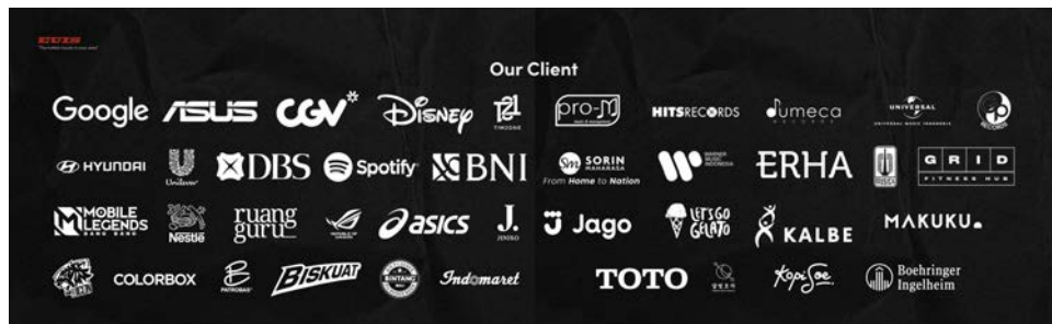
Gambar 2.3 Beberapa Klien EUIS Studio

Melalui kerja sama tersebut, terdapat rangkuman yang akan dijelaskan berdasarkan proyek terbaru dari EUIS Studio. Beberapa proyek tersebut terdiri dari video produk komersial dan juga music video serta dance cover . Berikut adalah beberapa konten terbaru yang diselesaikan melalui kerja sama dengan EUIS Studio.