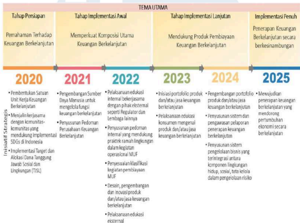
Gambar 2.3 Roadmap Keuangan Berkelanjutan

Berdasarkan dari roadmap Keuangan Berkelanjutan, maka terdapat pada Tahun pertama (2020), Perseroan menetapkan 3 (tiga) target kegiatan prioritas dengan indikator keberhasilan yaitu sebagai berikut :