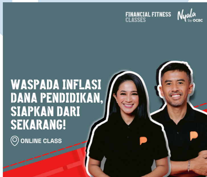
Gambar 2.6 Kelas Ruang MeNYALA

Ruang MeNYALA juga menyediakan layanan Financial Fitness Check Up dan konsultasi keuangan untuk mencari tahu apakah keuangan kamu sudah sehat, seberapa efektif investasi kamu, mengecek dana darurat agar keuangan menjadi lebih aman, mencari tahu apakah kamu bisa mengambil hutang baru atau tidak, serta membuat persiapan untuk memperbaiki keuangan dan menjadi lebih financially fit (Ruang MeNYALA, 2024).