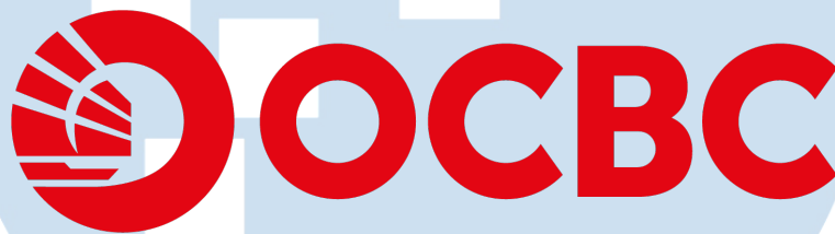
Gambar 2.1 Logo Bank OCBC Indonesia

Kini Bank OCBC Indonesia berada dalam naungan PT Bank OCBC NISP Tbk dengan visi untuk menjadi mitra terpercaya untuk memperkaya kualitas hidup yang diiringi juga dengan misi untuk memberikan solusi yang inovatif dan relevan, membangun kerjasama yang saling menguntungkan berdasarkan kepercayaan dan kehati-hatian, serta menciptakan lingkungan progresif dengan semangat kekeluargaan. Dilansir dari website resmi OCBC Indonesia, kini Bank OCBC Indonesia memiliki produk dan layanan yang terdiri dari 5 kategori, yaitu layanan personal, UMKM, korporasi, syariah, dan digital (OCBC, 2024).