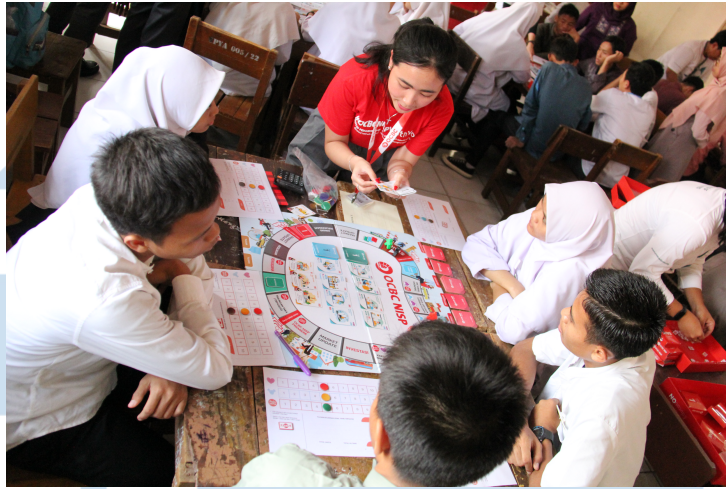
Gambar 2.3 Program Edukasi CSR OCBC

Dengan memfokuskan pada bidang kesehatan dan lingkungan, PT Bank OCBC NISP Tbk berkomitmen untuk meningkatkan kualitas hidup masyarakat dalam aspek kesehatan dan lingkungan dengan program #ONSociety. Program tersebut memfokuskan pada penanganan isu sosial dengan rangkaian pelatihan pengembangan keahlian dan pembangunan infrastruktur yang ramah lingkungan untuk mendukung pembangunan Bangsa. Selain itu, program ini pun mengajak para karyawan untuk meningkatkan awareness dan kepedulian terhadap lingkungan sekitar (OCBC, 2024).