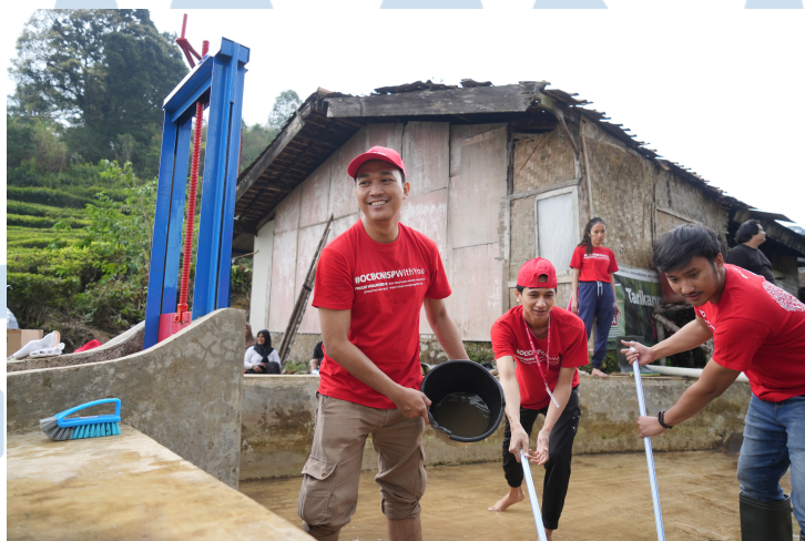
Gambar 2.4 Program Kesehatan dan Lingkungan CSR OCBC

Dengan memfokuskan pada bidang kesehatan dan lingkungan, PT Bank OCBC NISP Tbk berkomitmen untuk meningkatkan kualitas hidup masyarakat dalam aspek kesehatan dan lingkungan dengan program #ONSociety. Program tersebut memfokuskan pada penanganan isu sosial dengan rangkaian pelatihan pengembangan keahlian dan pembangunan infrastruktur yang ramah lingkungan untuk mendukung pembangunan Bangsa. Selain itu, program ini pun mengajak para karyawan untuk meningkatkan awareness dan kepedulian terhadap lingkungan sekitar (OCBC, 2024).