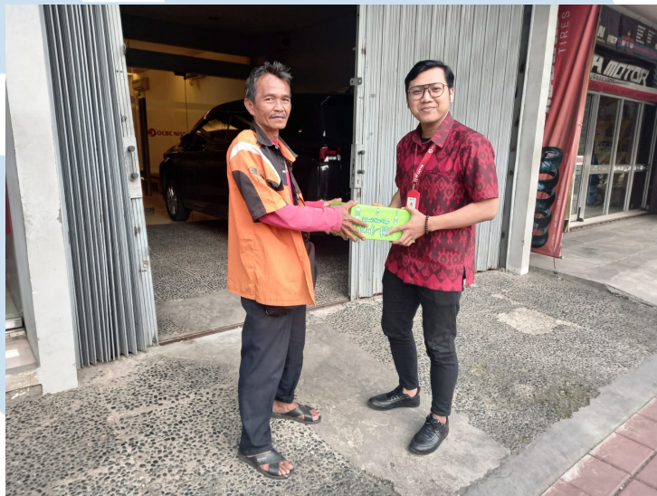
Gambar 2.5 Program Kemanusiaan CSR OCBC

terlibat dan berperan aktif dalam memberikan dukungan sosial untuk pemulihan bencana alam melalui program #ONSharing. Program tersebut merupakan agenda tahunan yang bertujuan untuk berbagi kasih dan memberikan dukungan sosial dengan membangun fasilitas umum di lokasi bencana, distribusi paket sembako, dan juga pemberian bantuan APD (OCBC, 2024).