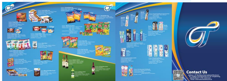
Gambar 2.3 Catalogue Product Orang Tua Group

Sejak berdiri dari tahun 1948, Orang Tua Group terus berkembang dan melakukan inovasi dengan menghasilkan berbagai jenis produk yang dikelola oleh perusahaan manufaktur OT seperti: PT Ultra Prima Abadi, PT CS2 Pola Sehat, PT Seruput Kava Abhinaya Nusantara, PT Cahyadewi Sehat Indonesia Abadi, PT Casa Verde Indonesia, PT Beverindo Indah Abadi, dan Alcohol Beverages yang kebanyakan mengelola produk makanan dan minuman. Kemudian terdapat distribution dibawah naungan OT yang bernama artaboga. Kemudian terdapat juga beberapa brand retail yang berada dibawah naungan OT seperti MOR, Beau, Bottle Avenue, Vinyard, Keizha & Soleha, dan sebagainya.