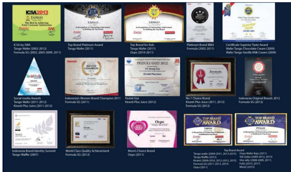
Gambar 2.4 Penghargaan yang Didapatkan Orang Tua Group

Contohnya seperti Top Brand Award, Indonesia Customer Satisfaction Award (ICSA), Superior Taste Award yang diberikan oleh International Taste and Quality Institute (iTQi) Belgium untuk merek yang menghasilkan produk dengan kualitas rasa, tekstur, dan komposisi bahan terbaik. Semua penghargaan dan pencapaian ini merupakan hasil dari dukungan dan kepercayaan konsumen untuk meningkatkan kualitas dan memotivasi OT untuk terus berinovasi.