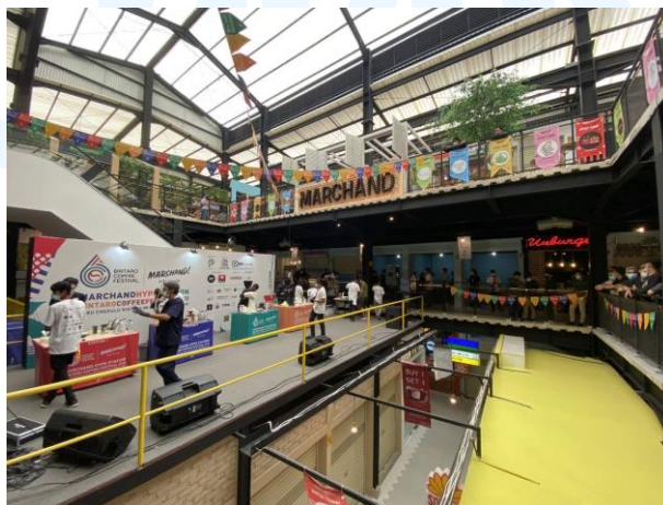
Gambar 2.5 Marchand Hype Station

Marchand hype station menjadi proyek area komersil pertama dari CHL yang mengusung konsep modern yang diadopsi dari area komersil di Australia dan Bangkok. Marchand memiliki lokasi yang strategis yaitu di pusat CBD Bintaro sehingga menjadi tempat yang tepat untuk anak muda ataupun keluarga menikmati hari mereka. Marchand juga memiliki banyak food and beverages tenant yang dapat dinikmati oleh para pengunjung di sana.