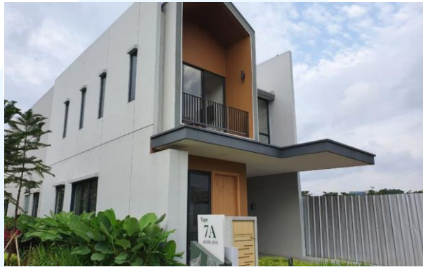
Gambar 2.4 The Sactuary Collection

strategis dan dikelilingi oleh banyak pusat perbelanjaan dan hiburan. The Sanctuary memiliki fasilitas yang lengkap di dalamnya seperti clubhouse , smart home , dan banyak fasilitas lainnya yang dapat digunakan oleh penghuni cluster tersebut.