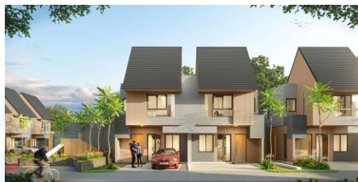
Gambar 2.7 Naraya Serpong

Naraya Serpong berlokasi di kawasan Tangerang Selatan dan memiliki konsep tropical modern yang menargetkan para gen z dan juga generasi milenial. Setiap unit dari Naraya Serpong di desain dengan cross ventilation dan juga panoramic windows serta memiliki ceiling yang tinggi. Naraya Serpong juga dilengkapi dengan berbagai fasilitas untuk menunjang kehidupan dari para penghuninya. Selain itu Naraya Serpong juga memiliki lokasi yang strategis dan dekat dengan pusat belanja.