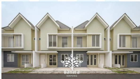
Gambar 2.3 Banara Serpong

Banara Serpong merupakan proyek pertama dari CHL berupa perumahan dengan lahan seluas 4 Ha yang menjadikan para milenial muda sebagai targetnya. Banara Serpong terletak di daerah Serpong, Tangerang Selatan dan hanya membutuhkan waktu 19 menit untuk sampai ke BSD. Banara Serpong juga dekat dengan beberapa aksesibilitas dan pusat hiburan dan belanja. Perumahan ini memiliki dua cluster yaitu Ambara dengan konsep Dutch-Inspired-Design dan Lenggana yang memiliki konsep Modern-Minimalist . Banara Serpong memiliki fasilitas yang lengkap seperti clubhouse , kolam renang, jogging track , Bali-themed Amphitheater dan sebagainya.