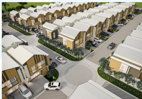
Gambar 2.6 Mazenta Bintaro

Mazenta Bintaro adalah proyek premium private residential dari CHL yang berlokasi di Bintaro. Mazenta Bintaro dirancang oleh arsitek terkenal dengan mengadopsi konsep modern Japanese ambience living . Mazenta Bintaro memiliki fasilitas tematik yang lengkap untuk menunjang konsep ambience Jepang seperti BBQ Area , Yoga Park , clubhouse , pet park dan masih banyak lagi. Perumahan ini berjarak 3 menit dari Bintaro Xchange Mall.