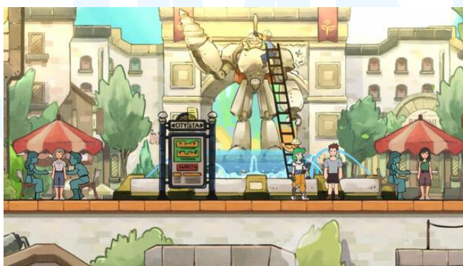
Gambar 2.3 Tampilan Gameplay Stella Gale: Trials of Faith

Gim Stella Gale: Trials of Faith menceritakan mengenai Stella, seorang anak perempuan yang bekerja sebagai seorang mekanik, yang pergi ikut serta menuju sebuah arena koloseum dengan harapan untuk menguak rahasia yang ditinggalkan oleh bapaknya yang sudah tiada.