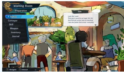
Gambar 2.4 Tampilan Kedua Gameplay Stella Gale: The Trials of Faith

Gim ini merupakan jenis gim RPG yang memiliki genre utama action , adventure dengan menggunakan side scroller beserta hack and slash sebagai gameplay utamanya.