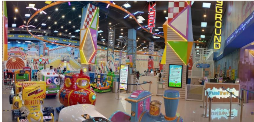
Gambar 2.6 Funtopia Lombok

Paragon baru saja mengadakan soft opening pada tanggal 7 Februari 2024 dan grand opening yang akan diselenggarakan setelah section playground dan go kart selesai dikonstruksi di masa yang akan datang.