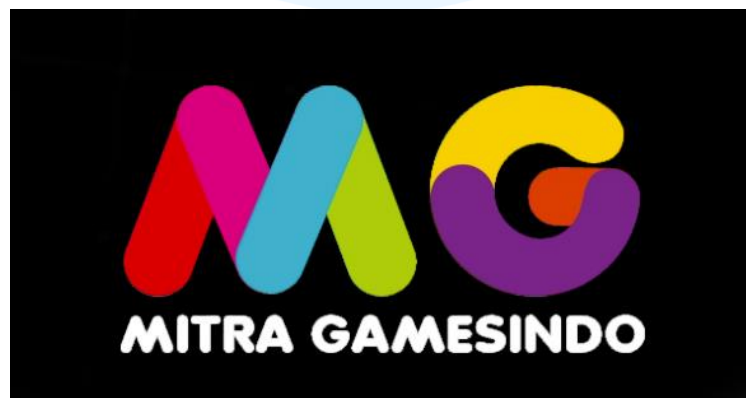
Gambar 2.1 Logo CV Mitra Gamesindo