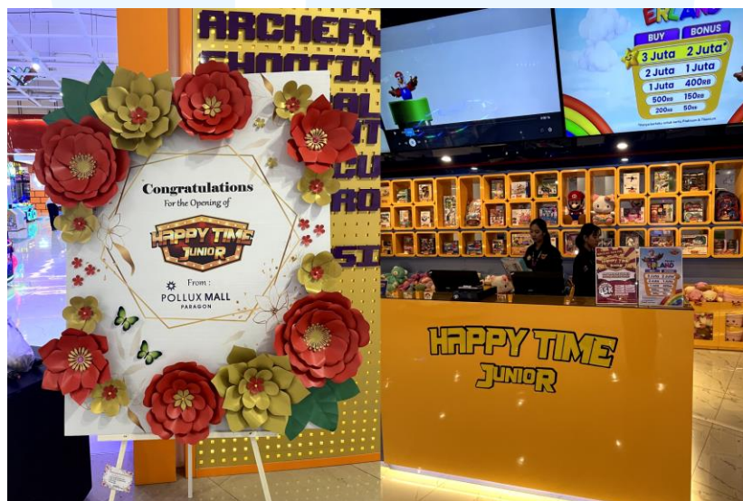
Gambar 2.5 Pembukaan Soft Opening Happy Time Junior Paragon Semarang

CV Mitra Gamesindo saat ini memiliki lebih dari 100 counter yang tersebar di seluruh wilayah Indonesia dengan persebaran terbanyak di Pulau Jawa. Persebaran counter di Pulau Jawa umumnya tersebar dengan konsentrasi tertinggi di Jawa Tengah dimana kantor pusat berada. Beberapa counter diluar Pulau Jawa yang baru-baru ini atau akan dibuka dalam waktu dekat adalah Happy Time Batam, Happy Time Bali, Happy Time Lombok, Happy Time Kapuas, Happy Time Ketapang, dan Happy Time Bontang.