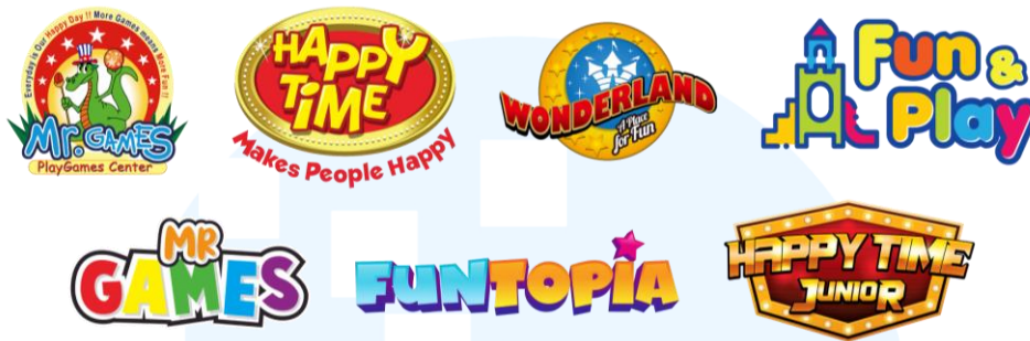
Gambar 2.2 Brand CV Mitra Gamesindo

pasar. Akan tetapi, esensi dari seluruh brand-brand di atas tetap sejalan dengan visi yang ingin diwujudkan oleh CV Mitra Gamesindo.