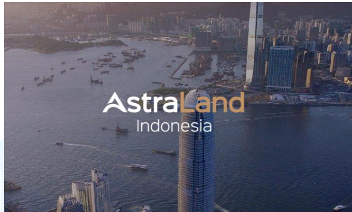
Gambar 2. 5 Logo Astra Land

Astra Land Indonesia merupakan bentuk kerjasama internasional antara perusahaan HongKong Land Limited dengan PT Astra Internasional TBK yang bertujuan untuk menjadi perusahaan properti dengan perkembangan tinggi di Asia.