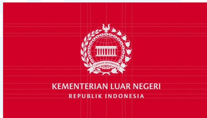
Gambar 2. 3 Portofolio Perusahaan KEMENLU

Salah satu client yang menggunakan jasa mereka adalah Kementerian Luar Negeri Republik Indonesia (KEMLU), sebuah kementerian Pemerintahan Indonesia yang mengurus keperluan luar negeri Indonesia dengan negara lain. Dalam upayanya memberikan penampilan identitas yang baru, Waykambas berusaha untuk mengintegrasikan filosofi, sejarah dan juga nilai-nilai dasar dari Kementerian ke dalam identitas visual.