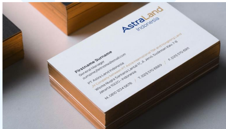
Gambar 2. 6 Stationery Astra Land MockUp

Astra Land Indonesia merupakan bentuk kerjasama internasional antara perusahaan HongKong Land Limited dengan PT Astra Internasional TBK yang bertujuan untuk menjadi perusahaan properti dengan perkembangan tinggi di Asia.