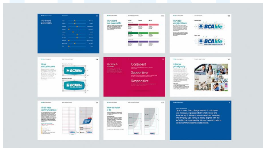
Gambar 2. 8 Branding Case BCA Life

BCA Group (Bank Central Asia) memiliki lebih dari ratusan cabang bank di seluruh Indonesia, sebagai bentuknya untuk meningkatkan pelayanan BCA Group memutuskan untuk masuk ke dalam industri bidang industri asuransi yang bertujuan untuk mengubah pandangan masyarakat yang berkeluarga terhadap pelayanan asuransi dengan memberikan produk dan layanan yang terpercaya dan inovatif yang disebut BCA Life.