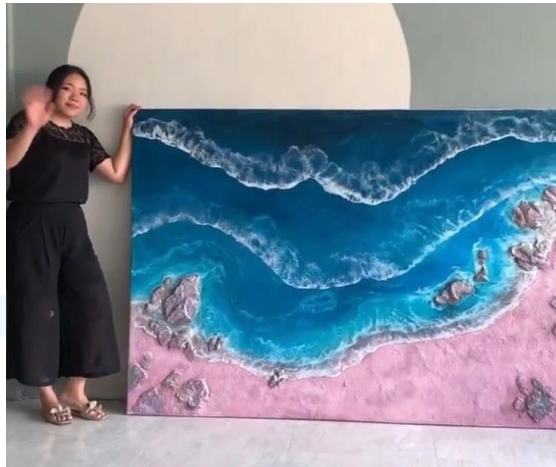
Gambar 2.6 Lukisan Pink Beach Honne Studio

Honne Studio juga membuat hasil karya yang tidak berhubungan dengan preservasi bunga. Sebelum perusahaan memfokuskan diri pada bidang pernikahan, Honne Studio sering membuat hasil karya seperti lukisan yang terbuat dari resin. Salah satu contohnya merupakan lukisan pink beach . Lukisan ini merupakan custom order dari salah satu pelanggan Honne Studio.