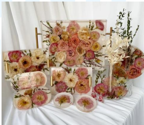
Gambar 2.3 Variasi Produk Honne Studio

Honne Studio merupakan perusahaan yang menyediakan jasa untuk preservasi bunga yang khususnya untuk bunga pernikahan. Honne Studio merupakan preservasi bunga wedding yang pertama di Indonesia. Produk inti Honne Studio terbuat dari gabungan resin dan hasil preservasi bunga. Selain menyediakan jasa preservasi bunga, Honne Studio juga menyediakan pilihan produk-produk yang dapat dibuat khusus tiap pelanggannya. Produk yang diproduksi oleh Honne Studio sangat bervariasi. Variasinya terdapat meja, tray, mini tray, oval tray, ring holder, jam, display, kaca, vas bunga, dan produk custom lainnya.