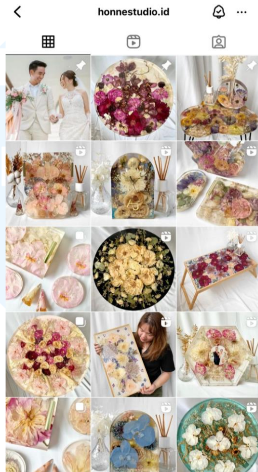
Gambar 2.7 Konten Instagram Honne Studio

lebih banyak order yang masuk dari pelanggan-pelanggan yang baru menikah. Berikut merupakan hasil contoh karya-karya Honne Studio yang terdapat di sosial medianya, yaitu Instagram .