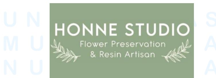
Gambar 2.1 Logo Honne Studio

Honne Studio menyediakan jasa layanan untuk preservasi bunga dan menjadikannya dalam bentuk produk yang berguna dalam rumah. Biasanya Honne Studio melakukan preservasi khusus bunga bouquet wedding , tetapi sering kali juga terdapat bunga-bunga yang berasal dari hari valentine , bunga duka, bunga ulang tahun, bunga anniversary , dan juga bunga graduation . Produk-produk home furnish yang disediakan oleh Honne Studio merupakan meja, kaca, tray , ring holder , jam, meja lipet, dan display . Honne Studio juga melakukan kerja sama dengan perusahaan florist bernama Baletton Flower Chef untuk setiap kali terdapatnya pelanggan yang membutuhkan jasa preservasi bunga.