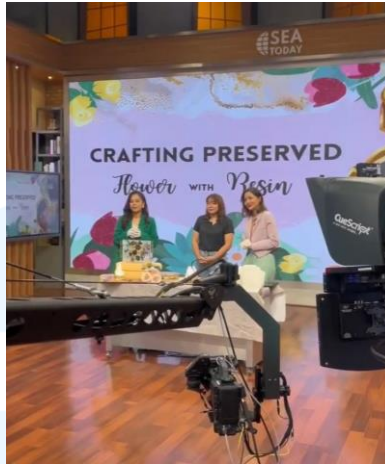
Gambar 2.5 Honne Studio Dalam Sea Today Live TV

Honne Studio juga membuat hasil karya yang tidak berhubungan dengan preservasi bunga. Sebelum perusahaan memfokuskan diri pada bidang pernikahan, Honne Studio sering membuat hasil karya seperti lukisan yang terbuat dari resin. Salah satu contohnya merupakan lukisan pink beach . Lukisan ini merupakan custom order dari salah satu pelanggan Honne Studio.