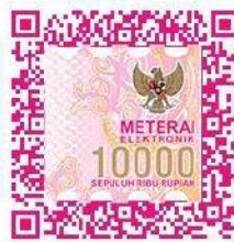
(Trissha Angellica Valda)