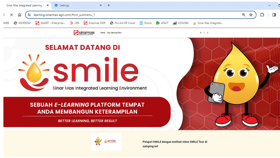
Gambar 2. 4 Website SMILE Sinarmas Agribusiness and Food

Website ini berisikan mengenai sejarah ataupun guidelines mengenai sinarmas. Website tersebut bernama SMILE (Sinar Mas Intergrated Learning Enviroment) pada website SMILE ini, banyak terdapat bagian-bagian yang interaktif yang dapat dimainkan oleh karyawan muda. Pada website tersebut, terdapat beberapa video ataupun guidelines yang dapat memudahkan karyawan yang baru masuk ke perusahaan untuk lebih mengerti perusahaan sinarmas.