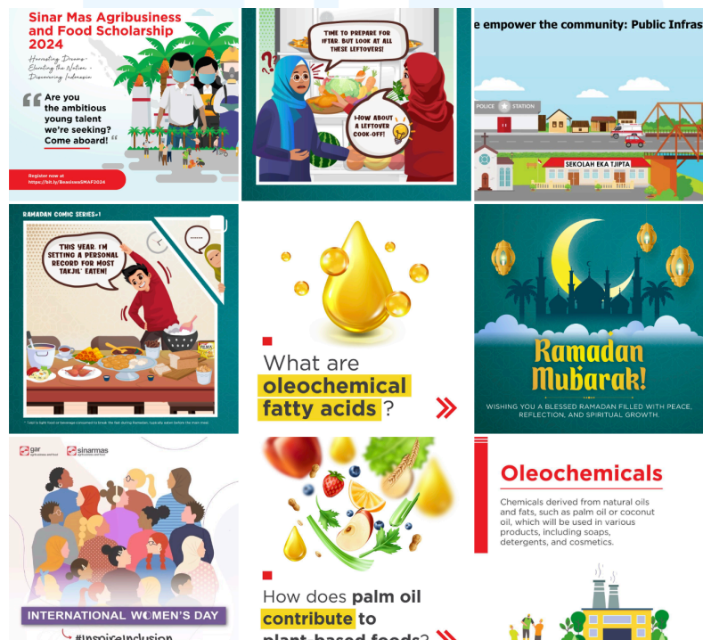
Gambar 2. 3 Instagram Sinarmas Agribusiness and Food

Perusahaan Sinarmas Agribisnis dan Pangan mengacu pada kumpulan bisnis dan usaha yang dimiliki dan dioperasikan dalam sektor agribisnis dan pangan. Portfolio ini mencakup berbagai macam kegiatan, termasuk pertanian, peternakan, pengolahan pangan, distribusi, dan perdagangan produk-produk pertanian dan pangan. Sinarmas memiliki beberapa platform untuk memberikan informasi mengenai usahanya melalui akun Instagram mereka yaitu Golden Agri Sinarmas,