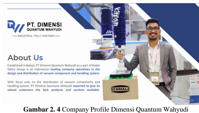
Gambar 2. 4 Company Profile Dimensi Quantum Wahyudi

Sebagai bagian dari salah satu perusahaan grup yang paling berpengaruh dan sebagai distributor resmi dari Schmalz, perusahaan teknologi terkemuka dari Jerman, PT Dimensi Quantum Wahyudi mendistribusikan produk asli dan berkualitas dengan solusi praktis, sesuai dengan tujuan utama kami untuk kepuasan pelanggan.