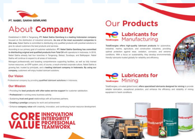
Gambar 2. 7 Company Profile Nabel Sakha Gemilang

Didirikan pada tahun 2006 di Tangerang, PT. Nabel Sakha Gemilang adalah perusahaan terkemuka di Indonesia yang berfokus pada distribusi pelumas industri. Sebagai salah satu perusahaan paling sukses di bidang ini, Nabel Sakha berkomitmen untuk mendistribusikan produk berkualitas tinggi dengan solusi praktis guna memberikan produk dan layanan terbaik kepada pelanggan mereka yang dihargai.