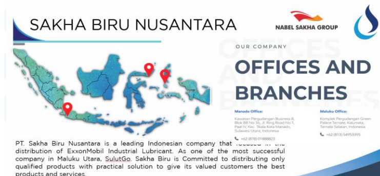
Gambar 2. 10 Company Profile Sakha Biru Nusantara

PT. Sakha Biru Nusantara adalah perusahaan terkemuka di Indonesia yang berfokus pada distribusi Pelumas Industri ExxonMobil. Sebagai salah satu perusahaan paling sukses di Maluku Utara, SulutGo, Sakha Biru berkomitmen untuk mendistribusikan hanya produk berkualitas dengan solusi praktis guna memberikan produk dan layanan terbaik kepada pelanggan mereka yang dihargai.