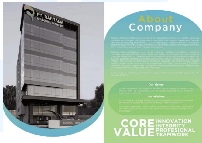
Gambar 2. 5 Company Profile Rafitama Milenial Wahyudi

Rafitama Millennial Wahyudi, sebagai bagian dari Nabel Sakha Group, adalah perusahaan terkemuka di Indonesia yang mendistribusikan komponen pneumatik dan hidrolis yang terutama digunakan dalam manufaktur. Didirikan pada tahun 2017 di Tangerang, PT. Rafitama Millennial Wahyudi berkomitmen untuk hanya mendistribusikan produk berkualitas dengan solusi praktis guna memberikan produk dan layanan terbaik kepada pelanggan mereka yang dihargai, sesuai dengan tujuan utama mereka untuk kepuasan pelanggan.