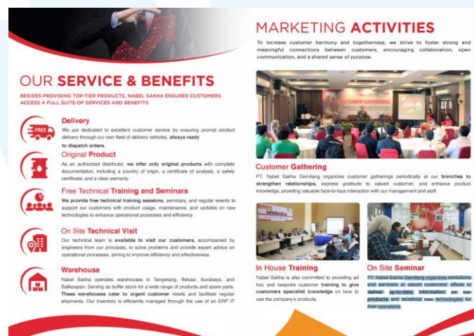
Gambar 2. 8 Company Profile Nabel Sakha Gemilang

Sesuai dengan tujuan utama mereka untuk kepuasan pelanggan, PT. Nabel Sakha Gemilang berkomitmen mendistribusikan produk asli dan berkualitas dari Total Oil di Indonesia. Pada tahun 2018, Nabel Sakha sudah memiliki empat cabang di Tangerang, Bekasi, Surabaya, dan Balikpapan. Nabel Sakha akan terus memperluas jangkauan ke seluruh wilayah Indonesia.