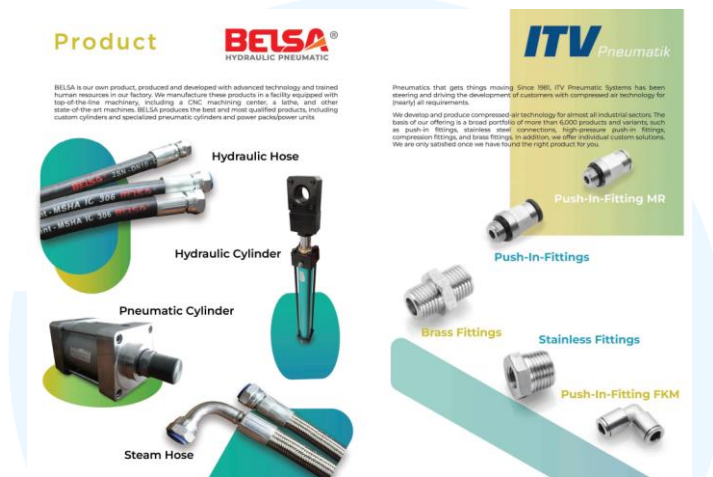
Gambar 2. 6 Company Profile Rafitama Milenial Wahyudi

komprehensif, sumber daya manusia yang terlatih sepenuhnya, dan Sistem IT SAP, PT. Rafitama Millenial Wahyudi berkembang pesat, dipercaya oleh prinsipal dan perusahaan manufaktur terkemuka di Indonesia.